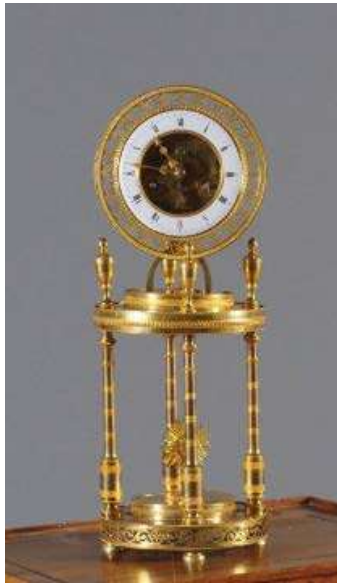
98 PENDULE SQUELETTE de forme ronde en bronze ciselé et doré, le cadran à motif ajouré repose sur un petit temple à colonnes terminées par des pots couverts. Fin du XVIII e siècle H. 39 cm € 400 - 500