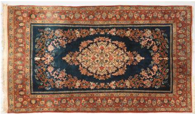
132 FIN GHOUM KORK Iran Époque du Shah Vers 1950/60 Laine et soie Velours en laine soyeuse d agneau de qualité, fleurs incrustées de soie sur fondations en coton Densité. Env. 7000 noeuds au dm2 Bon état général Champ marine à large rosace centrale florale ivoire et rubis en forme de diamant allongé entouré d une large couronne de fleurs et feuillages stylisés en polychromie Triple bordures dont la principale rubis à semis de bulbes et boutons floraux 216 x 138 cm € 200 - 300