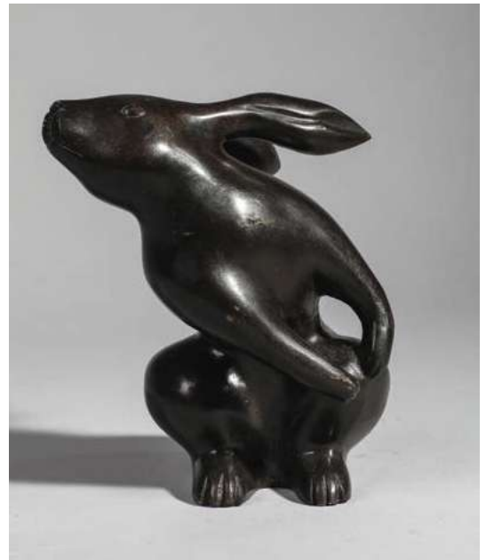
84 Dans le goût de François POMPON (1855-1933) LAPIN Sculpture en bronze à patine brune non signée H. 19 cm, L. 15 cm, P. 13 cm € 600 - 800