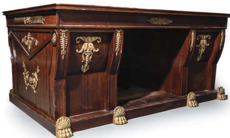
120 BUREAU À CAISSON en hêtre teinté façon acajou, ouvrant à deux tiroirs en ceinture et deux caissons à tiroirs basculant et deux tiroirs en partie basse. Il repose sur un socle de forme Hémicycle. Ornementation de bronze. On y joint huit pieds « griffe » en bronze doré, style Empire, XX e siècle H. 76 cm, L. 164 cm, P. 110 cm (Accidents et Restauration) € 1 000 - 1 200