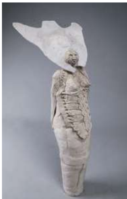
151 FEMME AU CHAPEAU debout, au décor moulé, dans un pneu. En terre cuite blanche et beige. H. 50 cm € 320 - 350