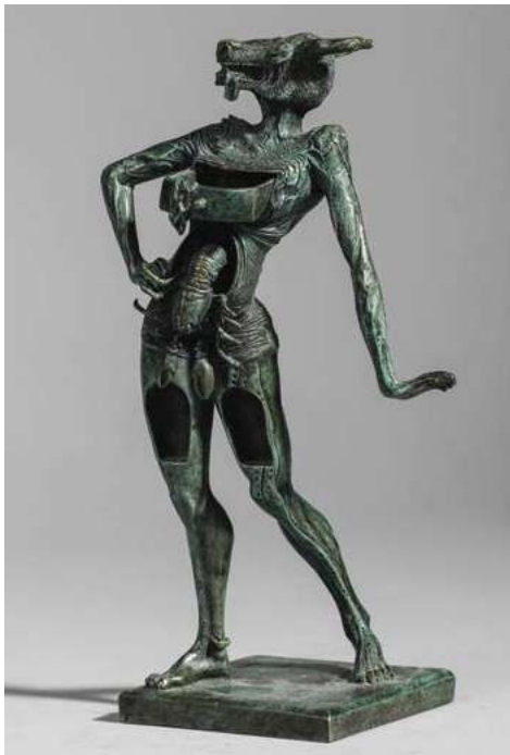
90 D'après Salvador DALI (1904-1989) LE MINOTAURE Sculpture en bronze à patine verte, signé sur la terrasse et marque du fondeur AIRAINDOR H. 18,5 cm, L. 9,5 cm, P. 8 cm € 200 - 300