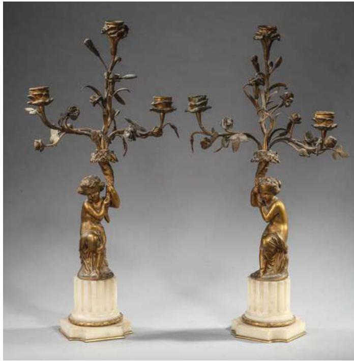
105 PAIRE D'ENFANTS PORTE-TORCHÈRES à trois bras de lumière en bronze doré reposant sur un socle en colonne Epoque Napoléon III 49,5 x 26 x 10,5 cm € 300 - 400