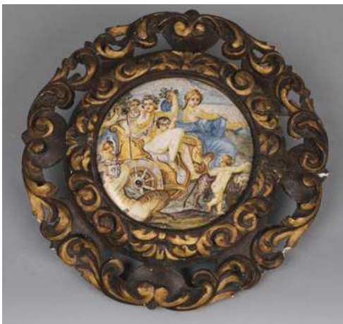
67 CASTELLI ? Majolique Italienne XVIII e siècle LE CHAR DE CERES Diam. 22,5 cm (Manque) € 400 - 600