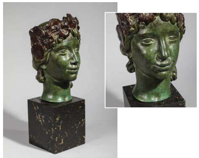
77 CVINO TÊTE DE BACCHANALE en bronze à patine verte signé sur le cou dextre. Elle repose sur un socle de marbre carré. Retirage H. 29 cm, L. 16,5 cm, P. 19,5 cm (sans le socle) € 200 - 300