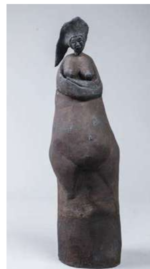
146 FEMME AU CHAPEAU debout, torse nu. En terre cuite noire. H. 50 cm € 320 - 350