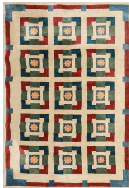
135 Original et grand TAPIS MODERNE contemporain XX e siècle 200 x 110 cm Tapis fait et noué à la main Velours au point noué en laine sur fondations en coton Bon état général A décor de trois rangées de cinq médaillons en forme de cubes incrustés de fleurs étoilées sur contrefond beige € 150 - 300