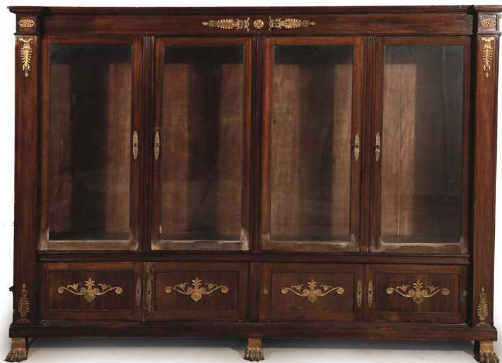
119 GRANDE BIBLIOTHÈQUE en hêtre teinté façon acajou. Elle ouvre en quatre portes vitrées et quatre portillons. Elle repose sur quatre pieds « griffe » en bronze. Ornementation de bronze, XX e siècle. Style Empire (Accidents) H. 189 cm, L. 253 cm, P. 42 cm € 1 000 - 1 200