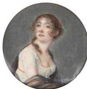
8 Ecole française PORTRAIT D'UNE ELEGANTE Miniature sur ivoire, cadre bois sculpté et doré circa 1830 Diam. 6,8 cm € 150 - 200