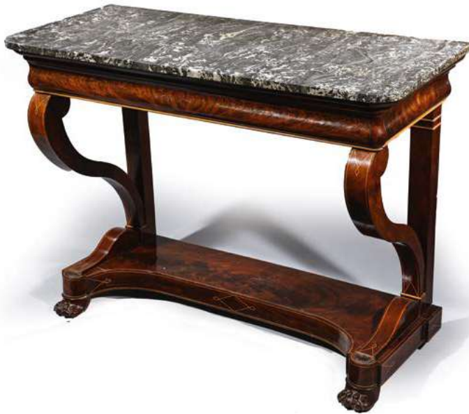
110 CONSOLE en acajou, placage d'acajou et filets de bois clair ouvrant à un tiroir en ceinture, montants à enroulements se terminant par un plateau incurvé reposant sur des pattes de lion. Dessus de marbre gris Saint Anne Travail d'époque XIX e siècle H. 88 cm, L. 123,5 cm, P. 53 cm (Restauration) € 500 - 700