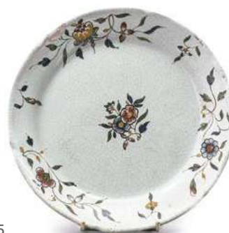
55 ROUEN Assiette à bord contourné en faïence à décor polychrome de tiges fleuries. Fin XVIII e siècle Diam. 23,7 cm Un éclat restauré € 30 - 50