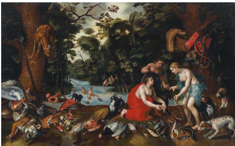
1 Ecole Flamande du XVII e siècle, suiveur de Jan BRUEGHEL LE JEUNE (1601-1678) LE RETOUR DE LA CHASSE Huile sur panneau de chêne 55 x 89 cm € 6 000 - 8 000 Vente PERRIN - ROYERE - LAJEUNESSE le 16 juin 1991, lot 37