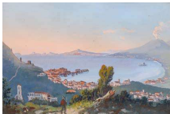
16 École Italienne fin du XIX e siècle LES RUINES DE POMPEI et la BAIE DE NAPLES Deux gouaches sur papier formant pendant 15,5 x 22,5 cm € 200 - 400