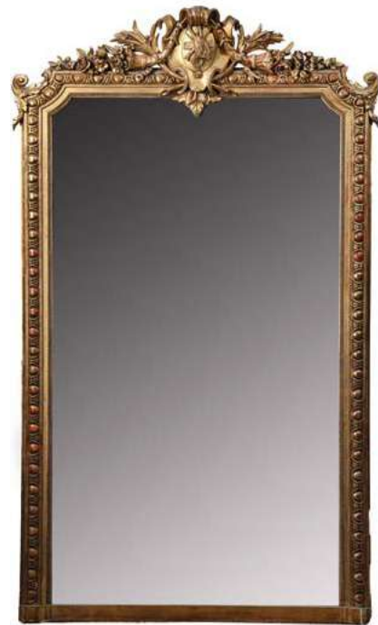
107 IMPORTANTE GLACE DE CHEMINÉE en bois naturel sculpté stuqué et doré. A l'amortissement, un décor aux attributs de musique flanqué de deux cornes d'abondance aux fleurs. Encadrement d'acanthes, montants ornés d'une frise de pastilles et de feuilles d'eau 216 x 128 cm € 1 000 - 1 200