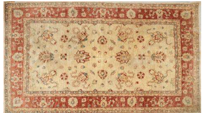
133 GRAND CHOBI - AGRA. ( Inde ). Vers 1980 Velours en laine soyeuse sur fondations en coton Bon état général Champ beige à semis de palmettes fleuries rubis et ivoire entourées de feuillages stylisés en torsades et en forme de pieuvres Cinq bordures dont la principale brique à décor rappelant le champ central 295 x 206 cm € 300 - 500