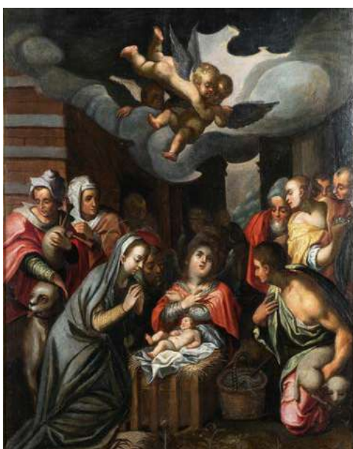
2 École flamande du XVII e siècle L'ADORATION DU CHRIST Huile sur panneau 66 x 51 cm € 1 200 - 1 500