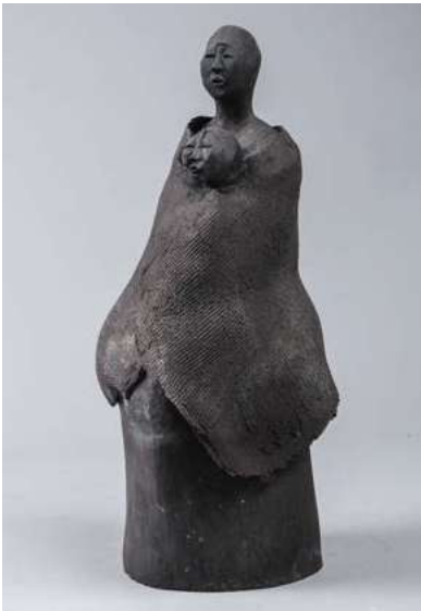
144 MÈRE TENANT SON ENFANT sous sa cape. En terre cuite noire. H. 40cm € 320 - 350