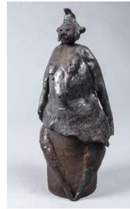
149 POT COUVERT en forme de femme à la coiffe tricorne debout, torse nu. En terre cuite noire. H. 39 cm € 320 - 350