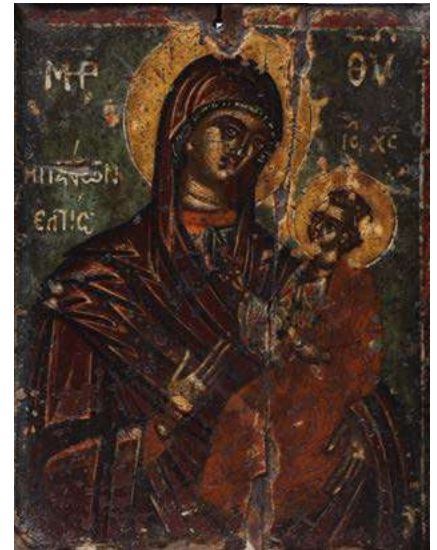
70 PETITE ICÔNE MONASTIQUE GRECQUE d'époque XVIII e siècle, dans un double cadre en bois doré de la même époque 9 x 10 cm (Fente) € 500 - 600