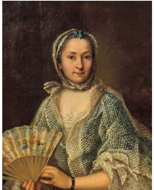
18 École Française, milieu du XIX e siècle FEMME A L'ÉVENTAIL Huile sur toile Cadre en stuc doré, éclats 76 x 61 cm € 600 - 800