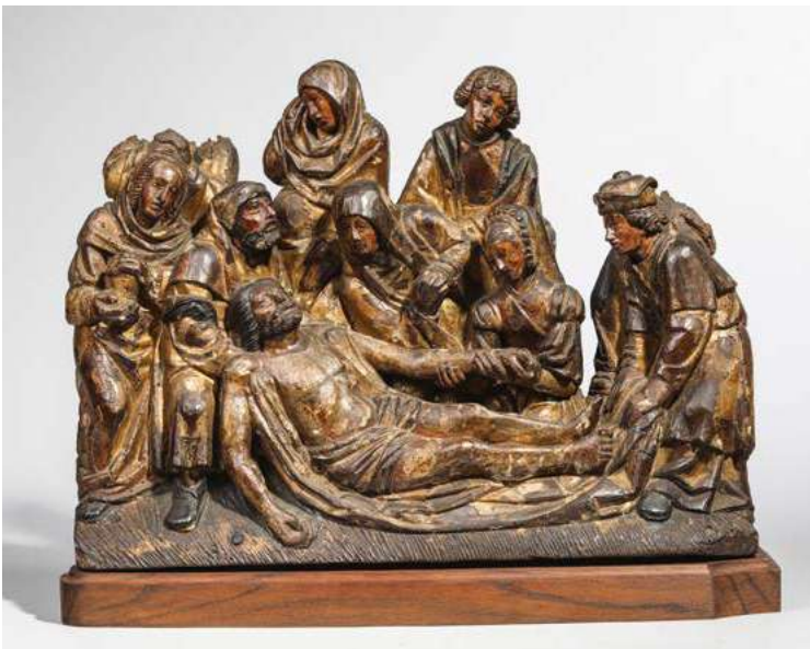
64 DESCENTE DE CROIX en bois naturel sculpté polychrome et trace de dorures. Fin XVII e début XVIII e H. 37 cm ; L. 45 cm ; P. 5 cm (manque deux têtes de personnages) € 600 - 800