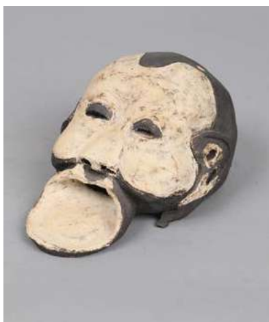
159 TÊTE D'HOMME à plateau enterre cuite noire et blanche. H. 29 cm € 260 - 280