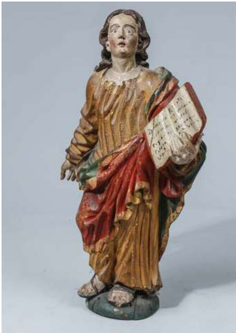
69 SAINT en bois sculpté polychrome tenant un livre dans la main gauche. Époque XVIII e siècle. H. 74 cm (Manques) € 300 - 500