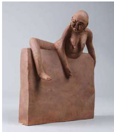
142 FEMME EMMURÉE en terre cuite orange. H. 30 cm € 320 - 350