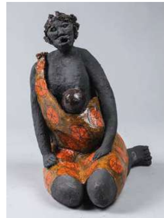
143 JEUNE FEMME AGENOUILLÉE allaitant, habillée d'une robe orange. En terre cuite noire et dont le vêtement est glaçuré orange. H. 28 cm € 320 - 350