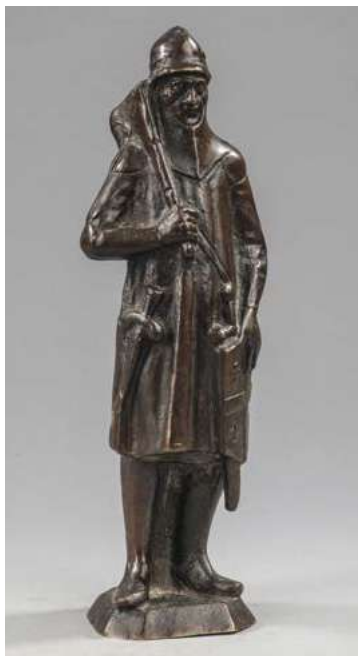
87 ANONYME CHEVALIER À LA HACHE Bronze à patine brune. Fonte d'édition ancienne, non-signée H. 27 cm, L. 7,5 cm, P. 6,5 cm € 200 - 300