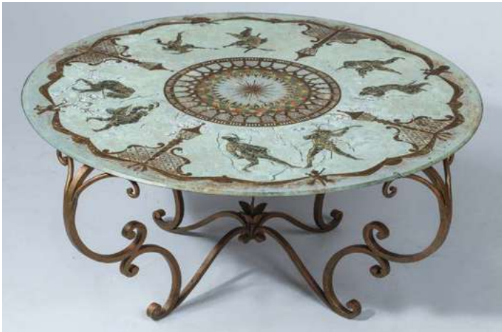
65 VERRE eglomisé ovale peint de personnages de la Comédia dell'Arte Époque XIX e siècle. Reposant sur un piétement en fer forgé à décor d'entrelacs réunis par une entretoise en X Diam. 74 cm € 300 - 400