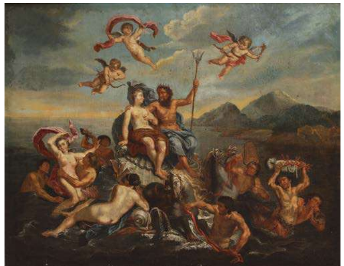
12 Dans le goût d'Antoine COYPEL NEPTUNE ET AMPHITRITE Huile sur toile 71 x 88 cm € 800 - 1 200