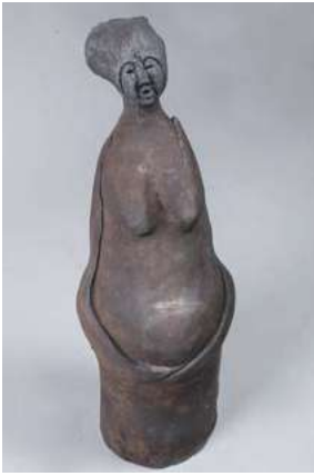
147 FEMME À LA COIFFE debout, torse nu. En terre cuite grise polychromée brune H. 42 cm € 320 - 350