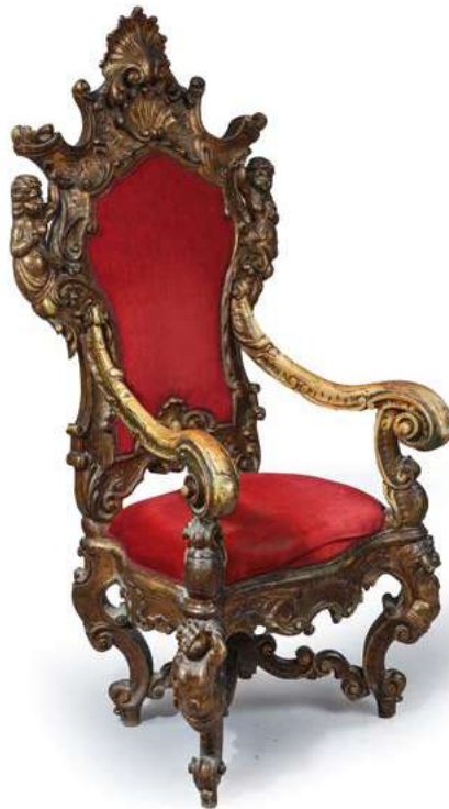
112 FAUTEUIL D'APPARAT en bois richement sculpté et rehauts de dorure, le dossier à décor de coquilles, palmettes et entrelacs encadrée par deux chérubins drapés. Les accotoirs à volutes se terminant par des piétements à enroulements reliés par une entretoise en X Les piétements antérieurs sculptés d'entrelacs et de chérubins en relief. Recouvert de velours rouge. Travail Italien du XIX e siècle. H. 164 cm, L. 84 cm, P. 69 cm € 600 - 800