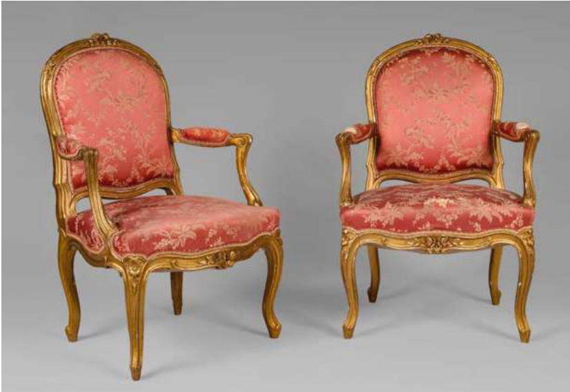
124 PAIRE DE FAUTEUILS À dossier plat dit « à la Reine » en bois sculpté et doré, à décor de fleurs sur le dossier en rappel sur la ceinture reposant sur des pieds cambrés ornés de fleurettes. Style Louis XV, époque XIX e siècle H. 89 cm, L. 54,5 cm, P. 51 cm (Accidents à la couverture) € 200 - 300