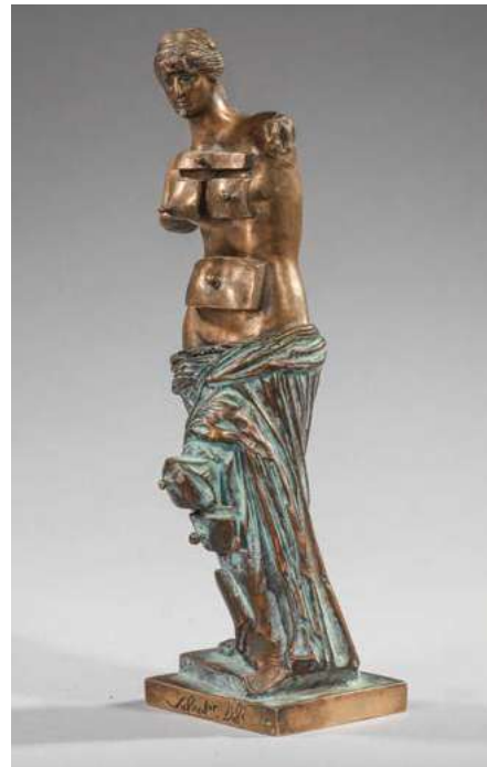
92 D'après Salvador DALI (1904-1989) VENUS AUX TIROIRS Epreuve en bronze à patine mordorée, signé sur la terrasse et marque du fondeur AIRAINDOR, numérotée 288/250 H. 20,5 cm, L. 6 cm, P. 7,6 cm € 200 - 300