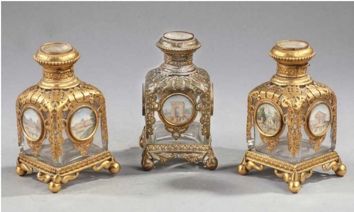
72 SUITE DE TROIS FLACONS, en cristal, montures en bronze doré figurants «toutes faces» dans des pastilles les monuments de Paris ainsi que sur les bouchons (Les Invalides, l'École Militaire, la Concorde, Notre Dame de Paris, l'Arc de Triomphe) Travail d'époque Restauration H. 11 cm (manque à un bouchon à l'un des flacons) € 400 - 600