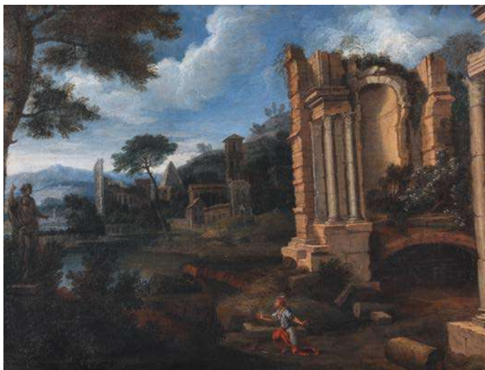
5 Ecole Française du XVIII e siècle SCÈNE MYTHOLOGIQUE DANS DES RUINES Huile sur toile 54 x 70 cm (Rentoilée) € 1 000 - 1 500