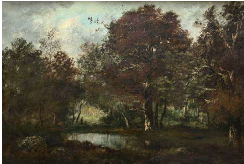
44 Dans le gout de Narcisse DIAZ DE LA PENA Plan d'eau dans un sous bois Panneau signé en bas à droite: «N. Diaz» Sans cadre 61,5 cm x 92,5 cm 400 - 600 €