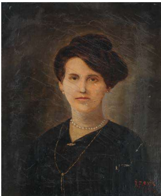
48 Ecole Française du début du XX e siècle PORTRAIT DE FEMME AU CHIGNON Huile sur toile, signé en bas à droite « J. FLEXIS » et daté 1914 46 x 36 cm € 80 - 120