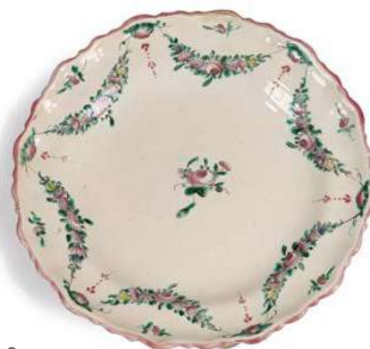
56 MOUSTIERS Assiette à bord festonné en faïence à décor polychrome de guirlandes de fleurs suspendues retenues par des coquilles. Filet rose sur le bord. Manufacture Ferrat. XVIII e siècle Diam. 25,4cm Un éclat restauré sur le bord € 80 - 120