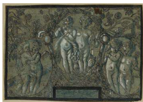
3 École du Nord XVII e siècle PROJET DE DÉCOR AVEC PUTTI Plume, encre brune et lavis brun, rehauts de gouaches blanche sur papier bleu de plusieurs feuilles assemblées dans un encadrement. 17,2 x 25 cm € 400 - 600