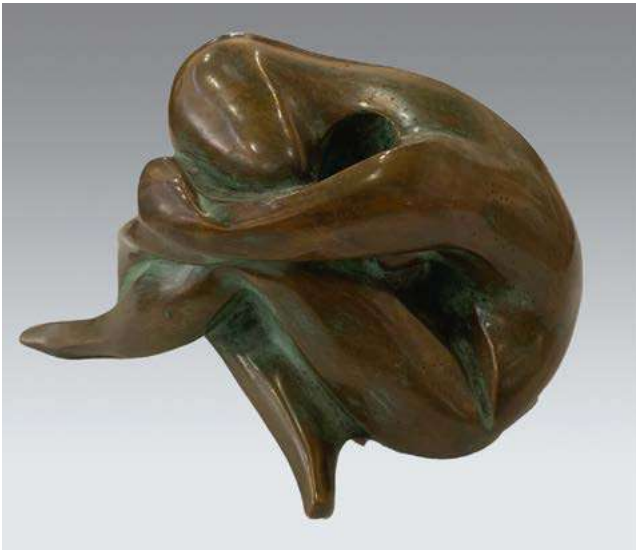
74 Anonyme « FEMME LA TÊTE DANS LES GENOUX » Sculpture en bronze à patine brune nuancée numéroté 1/8 et cachet du fondeur Italien Venturi Arte sur la jambe senestre 24 x 14 x 13 cm € 300 - 400