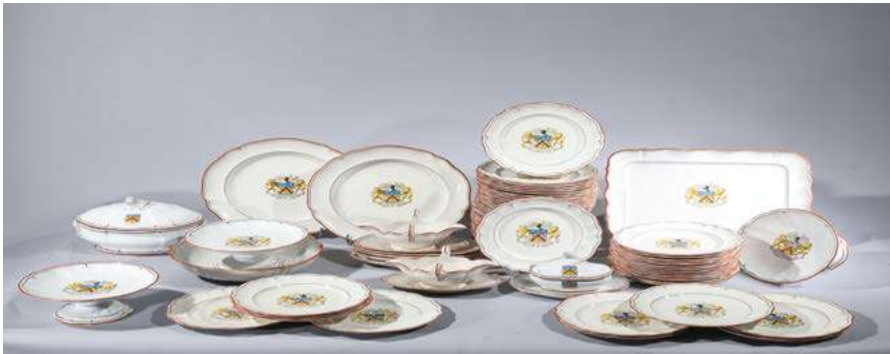
63 LUNEVILLE Soixante assiettes, une grande et une petite soupière, deux saucières, trois plats présentoirs, un saladier, un plateau, deux grandes assiettes, deux ramequins ovales. Décor aux armes surmontées d'un heaume comtal € 300 - 500