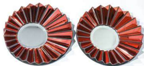
129 Olivier de SCHRIJVER (né en 1958) Paire de petits Simba rouge numéroté N°21 et 22/240 Diam. 50 cm € 500-800