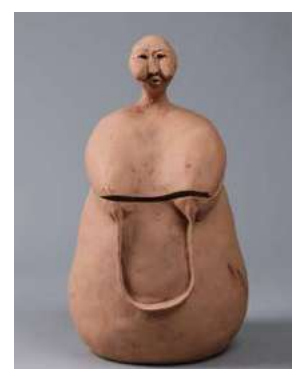
155 URNE figurant une femme. En terre cuite orangée. H. 33 cm € 260 - 280