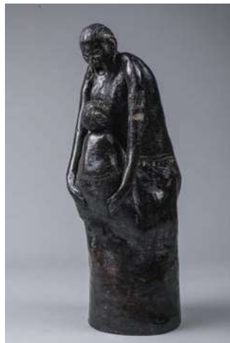
145 FEMME DEBOUT ALLAITANT. En terre cuite noire vernissée. H. 28 cm € 320 - 350