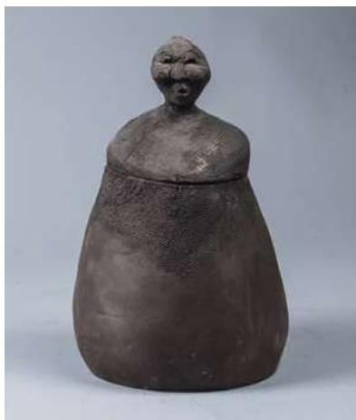
156 URNE figurant une femme. En terre cuite noire. H. 32 cm € 260 - 280