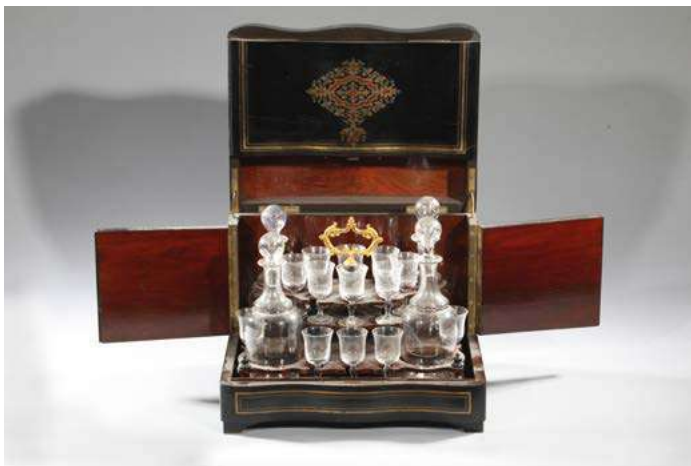
66 CAVE À LIQUEUR en bois noir et bois de placages et incrustations de cuivre monogrammée « LQ » Époque Napoléon III Comportant 4 carafons en verre et 16 verres à liqueurs en cristal de Sèvres. 27 x 32,5 x 24 cm € 600 - 800