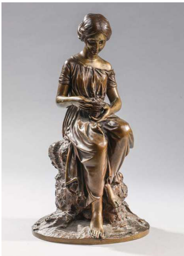
78 Anonyme FEMME À LA CORBEILLE DE POUSSINS SUR UN ROCHER Sculpture en bronze à patine brune nuancée. Fonte d'édition ancienne signée sur la terrasse SUSSE F. H. 32 cm, L. 17 cm € 800 - 1 000