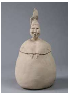
154 URNE figurant une femme portant une coiffe. En terre cuite blanche. H. 32 cm € 260 - 280