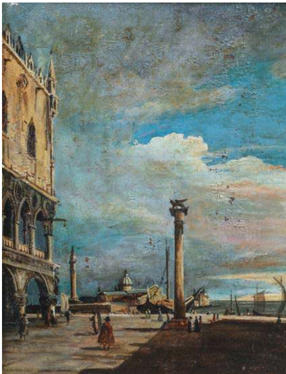
19 École Italienne fin XVIII e - début XIX e siècle LA PLACE SAINT MARC Huile sur panneau Trace de signature bas à droite 24 x 18,5 cm (Petits manques) € 600 - 800