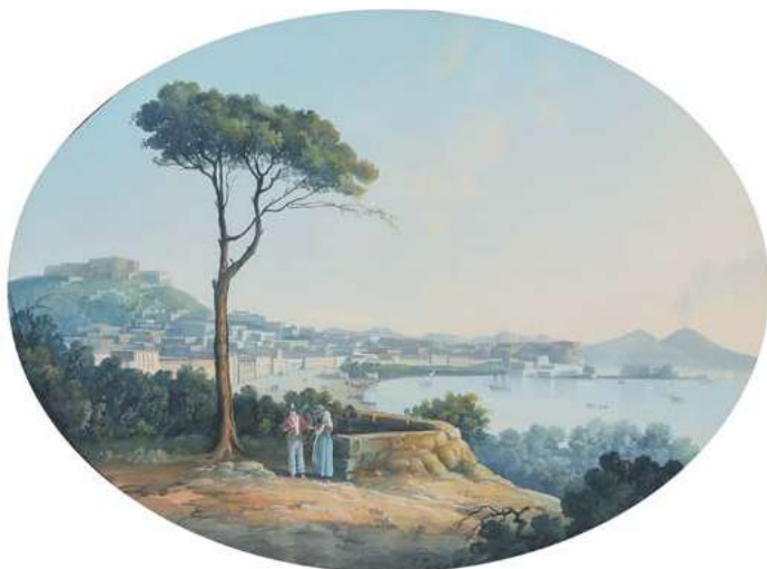
15 École Napolitaine du XIX e siècle VUE DE LA BAIE DE NAPLES AVEC LE VESUVE Gouache ovale sur papier 29 x 38,5 cm € 1 000 - 1 200