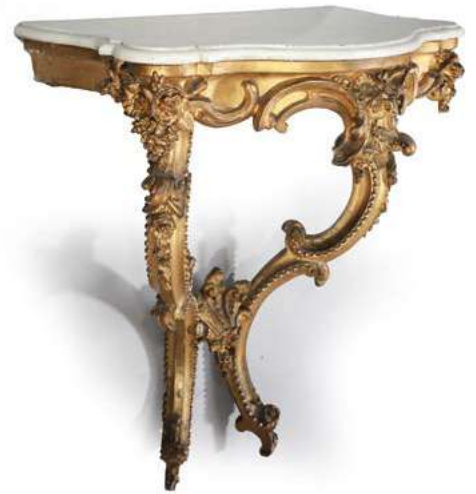
111 PETITE CONSOLE en bois sculpté stuqué et doré à décor rocaille de fleurs, palmettes et feuilles d'acanthe Piètement à entrelacs, dessus de marbre blanc à bec de corbin H. 87 cm, L. 68 cm, P. 41,5 cm € 200 - 300