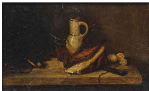
23 École Française du XIX e siècle NATURE MORTE AU PICHET Huile sur carton 16 x 26 cm (Manques) € 100 - 150