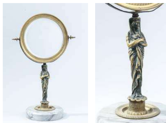
104 PSYCHÉ DE TABLE en bronze, le piétement à décor d'une athénienne coiffée du némés supportant un miroir rond dans un encadrement en bronze à décor d'une frise d'entrelacs et d'une frise de palmettes. Socle de marbre gris veinés. Époque Napoléon III H. 42 cm, L. 26 cm, P. 15,4 cm € 250 - 350