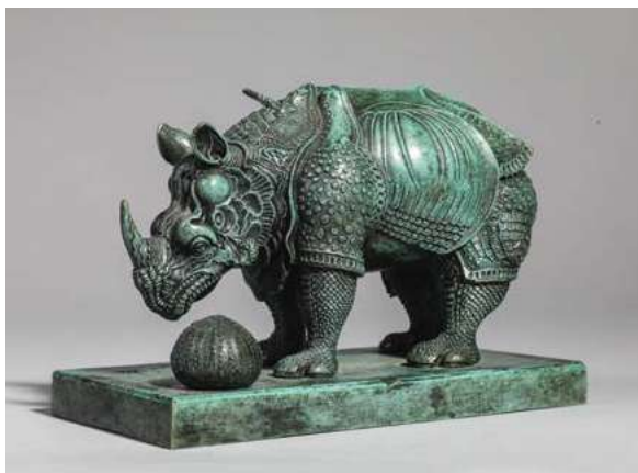
91 Salvador DALI « RHINOCÉROS » Fonte en bronze de patine verte signé sur la terrasse H. 11,5 cm, L. 16 cm, P. 8,8 cm € 200 - 300