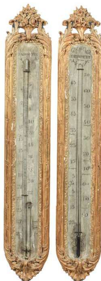
102 PAIRE DE BAROMÈTRES-THERMOMÈTRES en bois sculpté et doré à motif de rubans, feuilles d'acanthé et coquilles en amortissement et panier fleuris au fronton Style Louis XVI, époque XIX e siècle H : 125 cm (Quelques accidents et restaurations) € 600 - 800