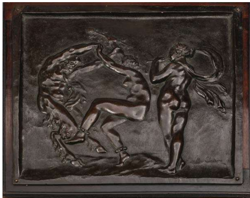
73 D'après CLODION (1738-1814) BACCHANALES Bas-relief en bronze signé en bas à droite « M.CLODION » et daté 1774 33 x 36,5 cm € 300 - 400