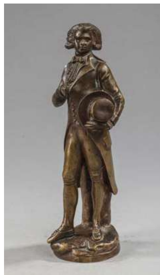
88 ANONYME « ÉLÉGANT AU CHAPEAU » Bronze à patine brune. Fonte d'édition ancienne non signée H. 18 cm, L. 5 cm, P. 4,5 cm € 120 - 150