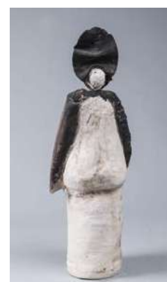
152 FEMME AU CHAPEAU debout, En terre cuite blanche, au chapeau et à la cape noire. H. 52 cm € 320 - 350