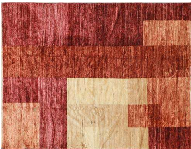
134 ORIGINAL ET GRAND MOKHTAR Inde Vers 1990 Velours en laine soyeuse sur fondations en coton Bon état général A décor géométrique de bandes et rayures stylisées ivoire,parme, grenat, rubis ,rose saumoné 245 x 177 cm € 300 - 400