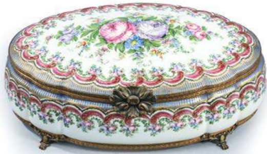
62 BONBONNIÈRE en porcelaine de Limoges à décors polychromes peints de roses, et de festons de fleurs. Cerclage de bronze doré reposant sur des pieds « griffe » 11,5 x 35,5 x 22,5 cm € 200 - 300