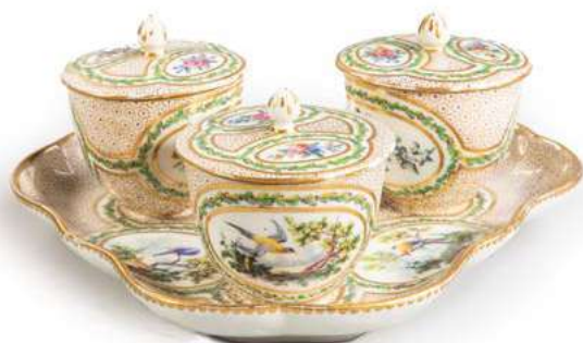
54 SÈVRES Plateau triangulaire à trois pots couverts adhérents en porcelaine tendre. Décor polychrome et or de réserves blanches ornées de scènes d'oiseaux entourées de guirlandes de lauriers sur fond oeil de perdrix. Filets or. Marque LL entrelacés La porcelaine XVIII e , la décoration postérieure L. 21,5 cm € 150 - 250