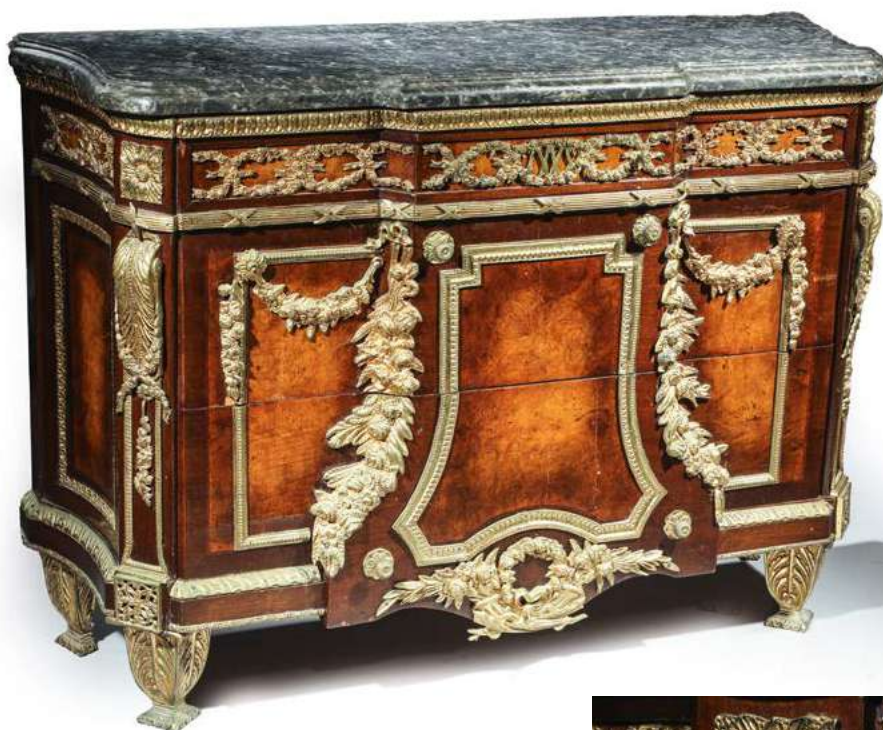
108 Atelier ROMEO DALLE d'après Jean-Henri RIESENER (1734-1806) Commode à ressaut central en bois de placage ouvrant par un tiroir en ceinture et deux grands tiroirs. Riche ornementation de bronzes ciselés et dorés tels que: feuilles d'eau, agrafes, Entrelacs de fleurs, festons, couronnes de fleurs. Dessus de marbre brèche. H. 100 ; L. 135 ; P. 45 cm € 4 000 - 6 000 Le modèle original se trouve au M.E.T Galerie 524 de New-york