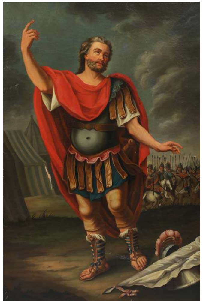
27 Ecole du XIX e siècle PORTRAIT D'UN HOMME A LA CUIRASSE Huile sur toile non signée 119 x 86cm (Manques) € 400 - 500