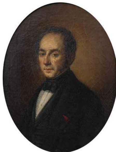
14 Ecole Française du XIX e siècle PORTRAIT D'UN ELEGANT EN COSTUME NOIR Huile sur toile 27,5 x 21,5 cm Beau cadre rocaille en bois sculpté et doré € 200 - 300