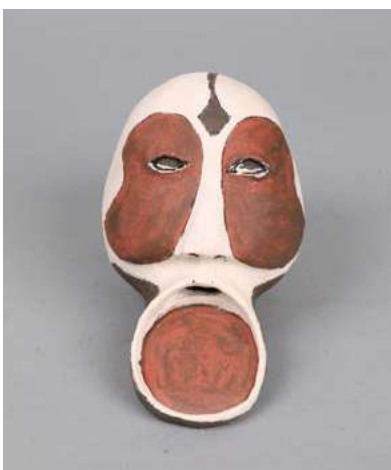
160 TÊTE D'HOMME à plateau enterre cuite rouge et blanche. H. 29 cm € 260 - 280