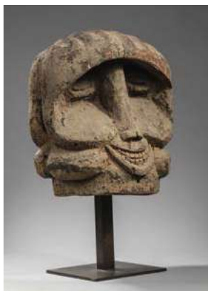
Masque Bangwa Cameroun

Le Jeudi 20 Octobre 2021 à 14h30 LIVRES, MANUSCRITS ET PHOTOS DE VOYAGES