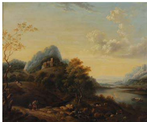
6 Ecole Française du XVIII e siècle PAYSAGE AUX BERGERS ET A LA RIVIERE Huile sur toile 44 x 54 cm (Accident) € 100 - 150