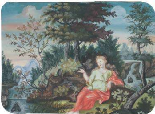
11 École du XVIII e siècle FEMME ASSISE AU BORD D'UN RUISSEAU Huile sur papier marouflée sur carton 15,8 x 20,6 cm € 150 - 200