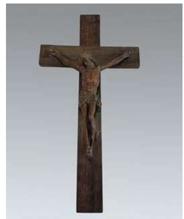
68 CHRIST EB BOIS NATUREL SCULPTÉ Travail régional du XIX e siècle H. 40,5 cm, L. 21 cm, P. 6,5 cm € 80 - 120