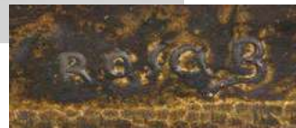
86 ROSA BONHEUR (1822-1899) LE TAUREAU Bronze à patine médaille signée sur la terrasse ROSA B. Fonte d'édition ancienne et signature PEYROL sur le côté droit de la terrasse. H. 15,3 cm, L. 21,5 cm, P. 8,3 cm € 700 - 800