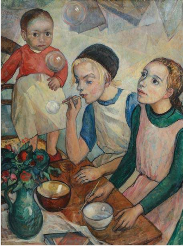
39 École Française duXX e siècle TROIS JEUNES FILLES FAISANT DES BULLES DE SAVON Huile sur toile non signée 86 x 73 cm (Accident et restauration) € 400 - 600