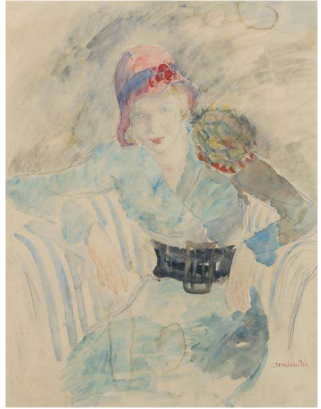
40 Constantin Andréévitch TERECHKOVITCH (1902-1978) FEMME AU CHAPEAU ROSE Aquarelle sur papier signé en bas à droite 66 x 50 cm (Tâches et papier insolé) € 400 - 500

Vente Kapandji Morhange 27 mars 2015 lot n° 56