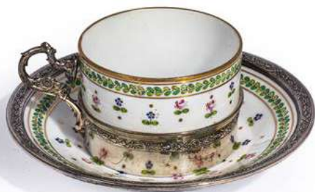
53 PORCELAINE DE PARIS Tasse à thé et sa soucoupe à décor polychrome et or de semis de fleurs et frise de feuillages entre des filets or. Fin XIXème Marque apocryphe de Sèvres La tasse est insérée dans une base avec anse en argent et cerclage en argent pour la soucoupe Tasse H. 6 cm - D. 9 cm Soucoupe : Diam. 17,5 cm € 80 - 120