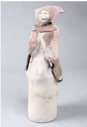
150 FEMME AU CHAPEAU debout, les bras sous sa cape. En terre cuite blanche et rosée. H. 50 cm € 320 - 350