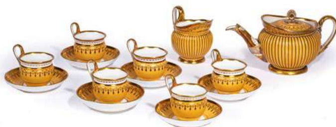
57 PORCELAINE DE PARIS Service à thé en porcelaine à fond jaune comprenant une théière et un pot à lait à décor de cannelures et de huit tasses à anses élevées et leurs soucoupes à décor de motifs or sur fond jaune. XIX e siècle Légère usure de l'or Théière H. 11,5 cm. Pot à lait H. 10,5cm, Tasse Diam. 7cm Soucoupe : Diam. 12,8cm € 400 - 600