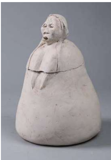
157 URNE figurant une femme. En terre cuite blanche. H. 39 cm € 260 - 280