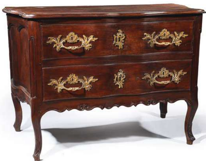
109 COMMODE DE PORT en acajou à façade mouvementé. Elle ouvre à deux tiroirs. Pieds cambrés se terminant par des feuilles d'acanthos. Époque Louis XV H. 84 cm, L. 99 cm, P. 68 cm (Fentes) € 2 000 - 3 000