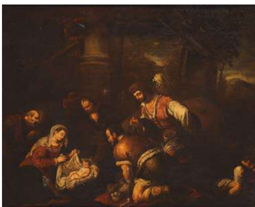
4 Ecole ITALIENNE vers 1700, suiveur des BASSANO ADORATION DES BERGERS Toile 65 x 81 cm (Accidents) € 1 200 - 1 500