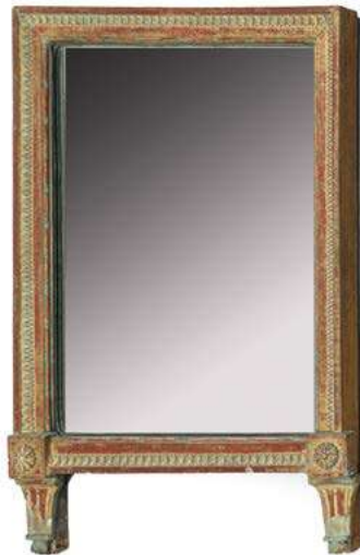
106 GLACE DE CHEMINÉE en bois naturel sculpté et doré, ornée d'une frise de feuilles d'eau. Style Louis XVI 86 x 60 cm € 150 - 200