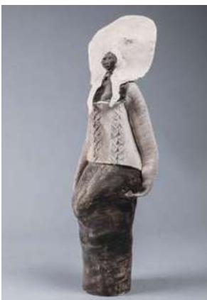
153 FEMME AU CHAPEAU debout, au décor moulé dans un pneu. En terre cuite blanche et au corps noirçi. H. 52 cm € 320 - 350