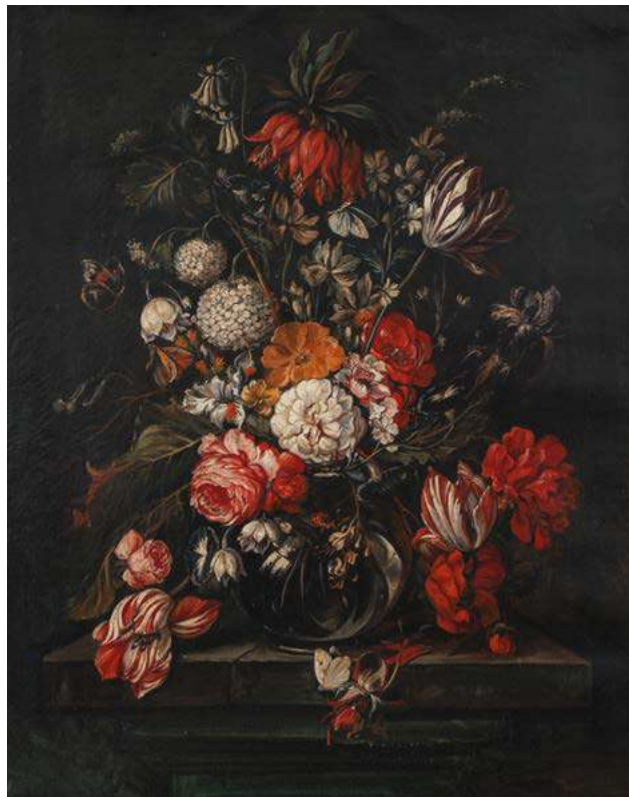
10 École Flamande du XVIII e siècle BOUQUET FLEURI SUR UN ENTABLEMENT Huile sur toile 60 x 49 cm € 2 000 - 3 000