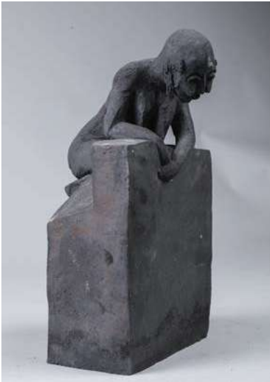
141 FEMME EMMURÉE en terre cuite noire. H. 29 cm € 320 - 350

Elle assiste régulièrement à des stages, des ateliers, autour des cultures du Nord et de l'Ouest de l'Afrique dans les arts, l'artisanat et les danses. Mes créations furent très influencées par ces traditions, elle s'en détache aujourd'hui petit à petit. Seul un animisme personnel demeure. En 2018, elle a commencé à enseigner la céramique sur un mode de pratique collective et collaborative dans un atelier intitulé Collab, situé à Sète, dans le sud de la France, sous forme de cours hebdomadaire ou de stages ponctuels. Et depuis elle a exposé dans plusieurs galeries de la région de Sète. Elle nous présente ici, un ensemble de ses terres cuites.