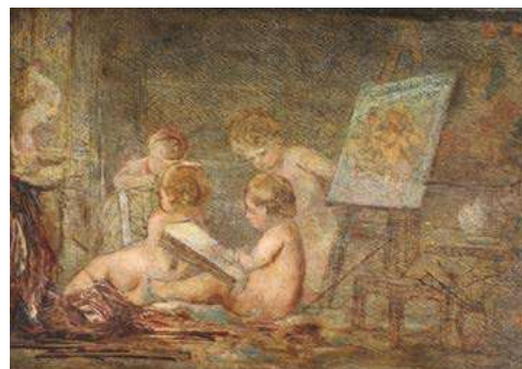
24 École du XIX e siècle ENFANT A L'ATELIER DE DESSIN Huile sur panneau de bois 13,5 x 20 cm (Fente) € 150 - 200