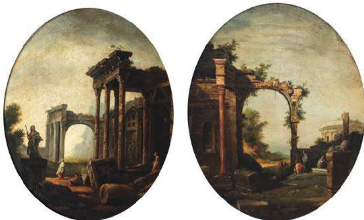
7 Ecole Française , milieu du XVIII e siècle PAIRE DE VUES OVALES AUX RUINES Huiles sur toiles marouflées sur panneaux, dans le goût de Hubert Robert 58 x 48cm € 600 - 800