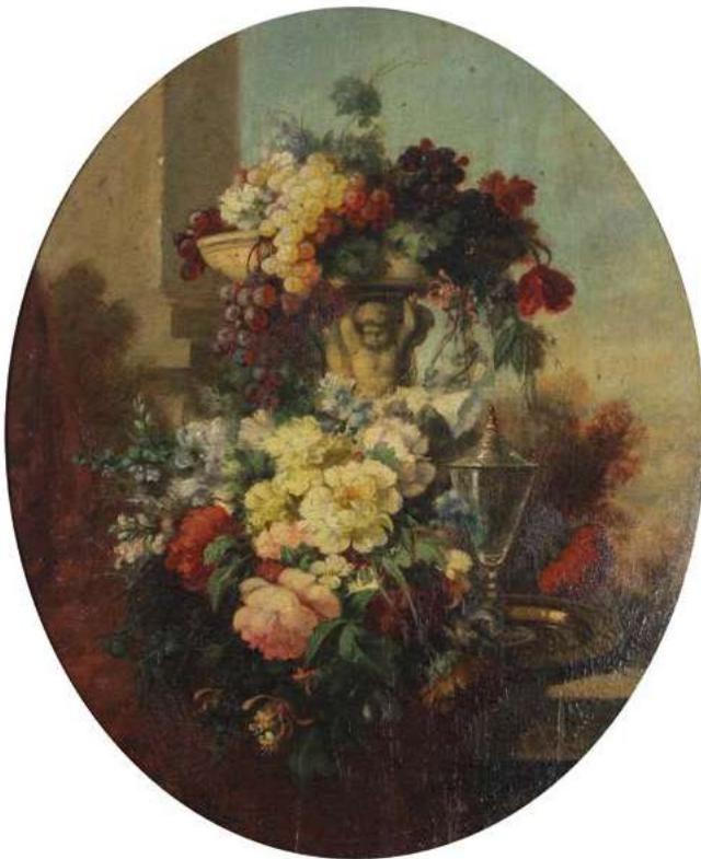
26 Ecole française du XVIII e siècle FRUITS ET BOUQUETS DE FLEURS SUR UN ENTABLEMENT Huile sur panneau signé en bas à droite 27 x 20 cm € 400 - 600