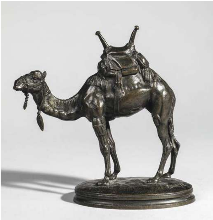
82 Antoine Louis BARYE (1795-1875) DROMADAIRE D'ALGERIE Epreuve en bronze à patine brune Fonte d'édition ancienne, signée sur la terrasse H. 17,5 cm, L. 18 cm, P. 7,3 cm € 200 - 300