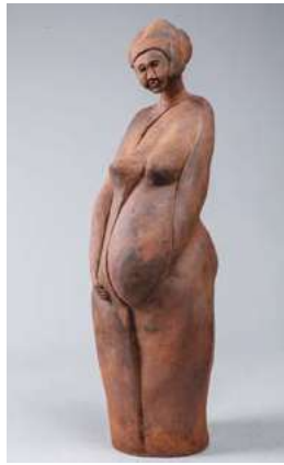
148 FEMME ENCEINTE au turban debout, torse nu, les bras le long du corps. En terre cuite orangée. H. 39 cm € 320 - 350