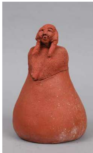
158 URNE figurant une femme. En terre cuite orangée. H. 29 cm € 260-280