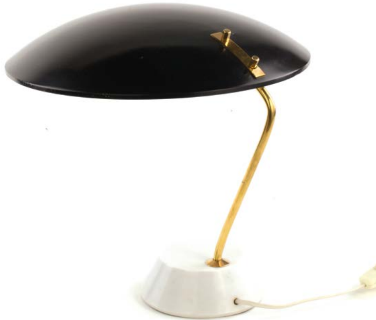
53 LAMPE 1023 DE BUREAU en marbre, laiton et aluminium laqué noir Modèle 1023 conçu par Bruno GATTA (XX-XXI) Édité par Stilnovo Italie, années 1960 H. 32 cm, Diam. 37 cm € 1 500 – 2 500