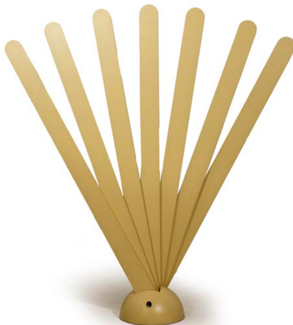
49 PORTE-MANTEAUX en claustra en bois sculptural Modèle «VENTAGLIO» conçu par Giovanni PASATTO (XX) Édité par Tarzia Italie, vers 1975 170 x 160 x 37 cm € 800 – 1 000