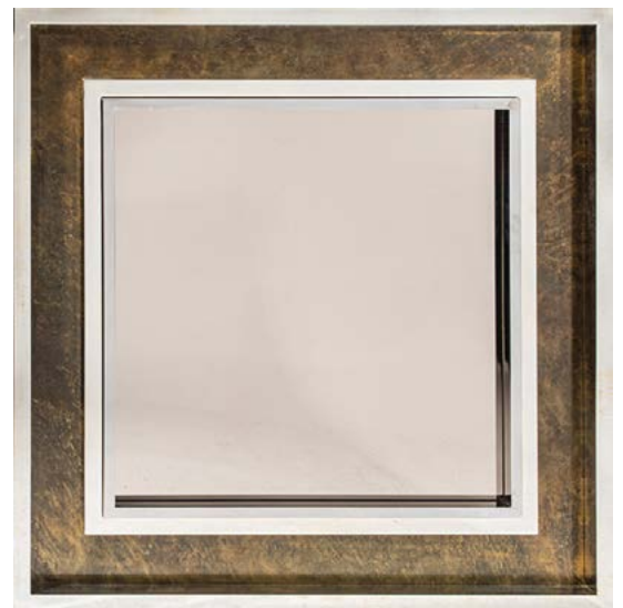
102 GRAND MIROIR en laiton et métal chromé Édité par Belgocrome Belgique, vers 1970 130 x 130 cm € 1 500 – 2 000