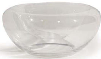
70 COUPELLE EN VERRE Modèle attribué à Alvar AALTO (1898-1976) Années 1970 H. 13 cm, Diam. 27 cm € 100 - 150