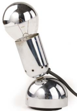
73 LAMPE À POSER pouvant former applique en métal chromé Modèle «POLLUX» conçu par Ingo MAURER (1932-2019) Édité par Mdesign Allemagne, années 1970 H. 16 cm € 200 - 350