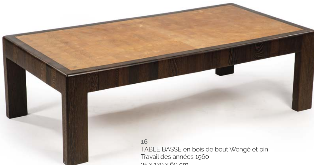
16 TABLE BASSE en bois de bout Wengé et pin Travail des années 1960 35 x 120 x 60 cm € 800 – 1 000