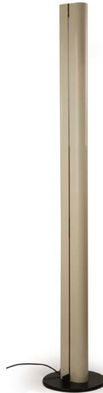
146 LAMPADAIRE en métal laqué Modèle «MÉGARON» conçu par Gianfranco FRATTINI (1926-2004) Édité par Artemide Italie, années 1970 H. 182 cm, Diam. Base : 32 cm € 300 – 700