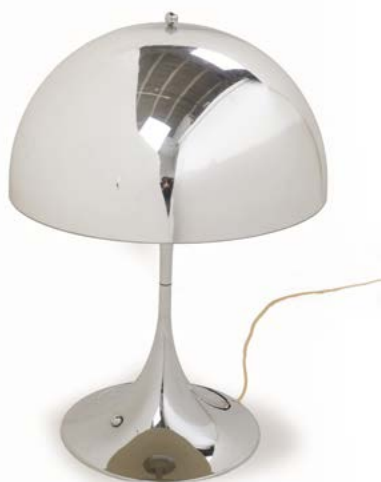
124 TRÈS RARE LAMPE en métal chromé Modèle « PANTHELLA » conçu par Verner PANTON (1926-1998) en 1971 Édité par Louis Poulsen Danemark, 1971 H. 70 cm, Diam. 50 cm € 800 – 1 500