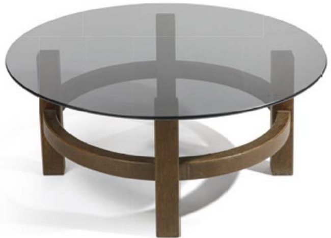
4 TABLE BASSE le piètement en bois massif et le plateau en verre fumé Suisse, années 1960 H. 39 cm, Diam. 95cm € 200 – 400