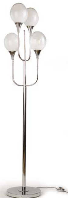
128 LAMPE DE SOL à quatre feux en métal chromé wet verre de Murano Modèle dans le goût de Goffredo REGGIANI (XX) Italie, années 1960 H. 162 cm, Diam. base : 26 cm € 1 100 – 1 500