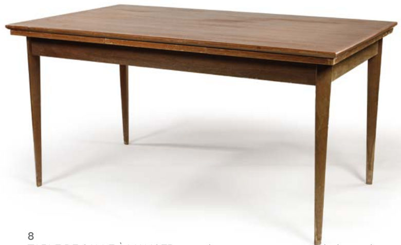
8 TABLE DE SALLE À MANGER en teck reposant sur quatre pied en gaine triangulaire, deux allonges Scandinavie, années 1960 75 x 150 x 70 cm sans les allonges € 300 – 500