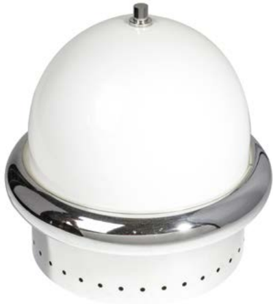
88 LAMPE DE TABLE en métal chromé et plexiglas Modèle Esperia Italie, années 1970 H. 39 cm, Diam. 40 cm € 400 – 600