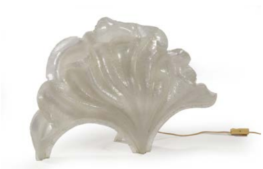
101 LAMPE COQUILLAGE structure en perspex et acrylique Modèle conçu par Laurent ROUGIER France, années 1970 35 x 85 x 25 cm € 300 – 800