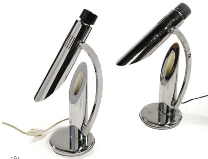
161 PAIRE DE LAMPES DE TABLE ARTICULÉES en métal chromé l'abat-jour orientable Modèle «THARSIS» Édité par Fase Espagne vers 1973 Espagne H. 45 cm, Diam. 15 cm € 400 – 800