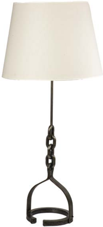
80 LAMPE DE SOL en fer forgé à decor de chaines France, années 1970-1980 H. 121 cm, Diam. 55 cm € 200 – 300