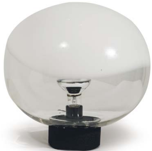
117 LAMPE DE TABLE en verre de Murano Modèle conçu par Roberto PAMIO (XX) Édité par Leucos Italie, années 1970 H. 33 cm, Diam. 34 cm € 400 – 600