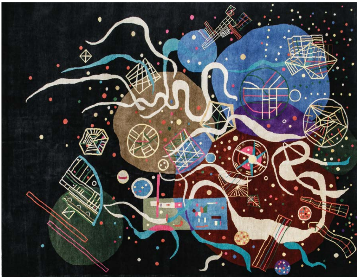
52 IMPORTANT TAPIS CONTEMPORAIN en velours de laine sur trame de coton noué à la main Réalisé d'après un carton de Vassily KANDINSKY (1866-1944) Travail du XX e siècle 300 x 250 cm € 3 200 - 4 000