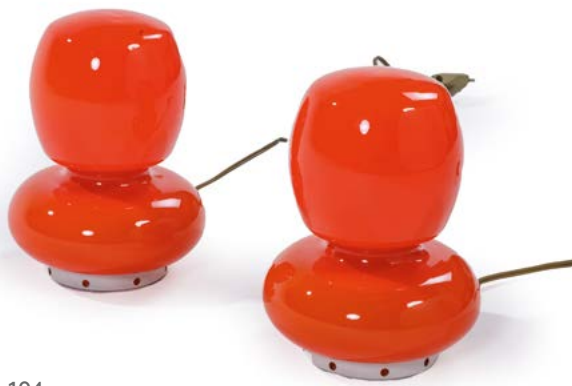
104 PAIRE DE PETITES LAMPES DE TABLE en opaline vermillon Années 1970 H. 16 cm, Diam. 15 cm € 150 – 300