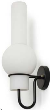
63 PAIRE D'APPLIQUES en métal laqué noir et globe en opaline blanc Modèle «Lucifer» Édité par RAAK Pays-Bas, années 1960 40 x 14 x 17 cm € 300 – 400