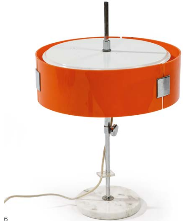
6 LAMPE À POSER en marbre blanc et abat-jour orange Édité par Stilux Milano Italie, années 1960 H. 43 cm, Diam. 32 cm € 300 – 400