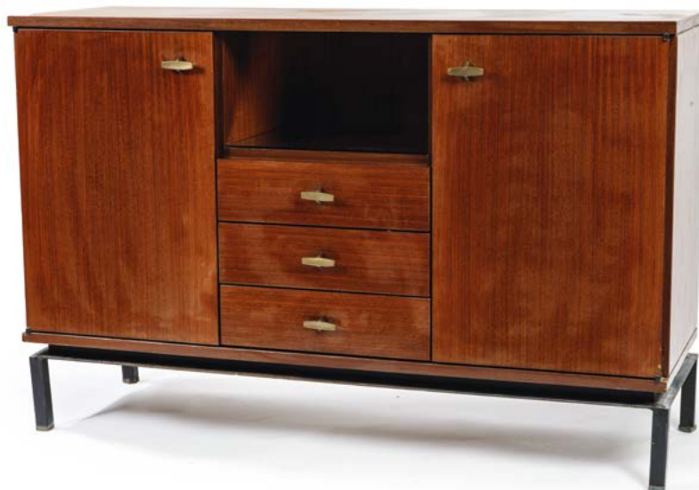
23 MEUBLE DE RANGEMENT en bois et piétement métal laqué noir Modèle conçu par Marcel GASCOIN (1907-1986) Édité par Alvéole France 89 x 136 x 46 cm € 100 – 500