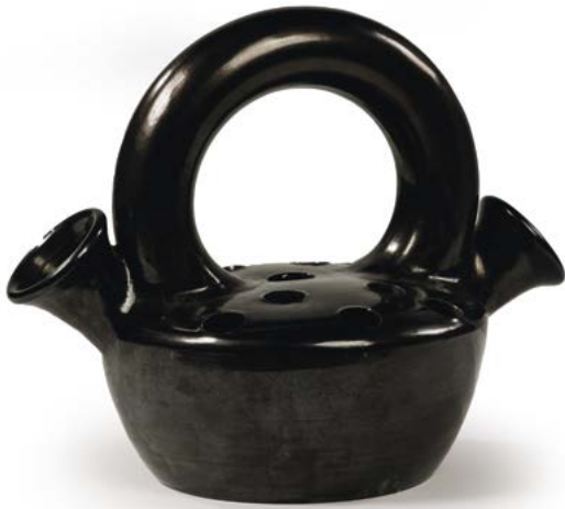
5 PIQUE FLEURS à anse centrale circulaire en faïence émaillée noire Modèle conçu par Atelier MADOURA VALLAURIS 30 x 36 x 24 cm € 150 – 200