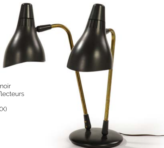
57 LAMPE DE BUREAU à double abat-jour noir à interrupteurs rotatifs à l'arrière des déflecteurs et laiton doré Modèle conçu par Gerald THURSTON (XX) Édité par Lightolier États-Unis, années 1960 48 x 36 x 20 cm € 500 – 1 000