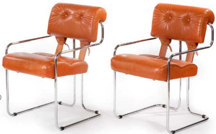
167 PAIRE DE CHAISES en métal chromé et cuir havane Modèle «TUCROMA» conçu par Guido FALECHINI (XX-XXI) Édité par Mariani Collection Pace 80 x 52 x 62 cm € 900 – 1 600