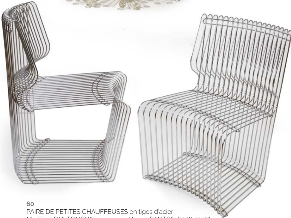
60 PAIRE DE PETITES CHAUFFEUSES en tiges d'acier Modèle «PANTONOVA» conçu par Verner PANTON (1928-1998) Édité par Fritz Hansen Années 1970 76 x 46 x 56 cm € 2 200 – 3 000