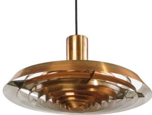
25 SUSPENSION en cuivre Modèle «LANGELINIE» conçu par Poul HENNINGSEN (1894-1967) Édité par Louis Poulsen pour le Pavillon Langelinie Danemark, années 1960 H. 25 cm, Diam. 43 cm € 1 200 - 2 000