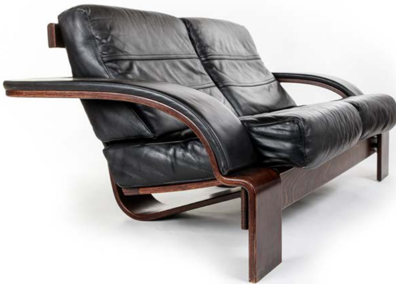
115 CANAPÉ 2-3 PLACES en palissandre et cuir noir Modèle «KROKEN» conçu par ake FRIBYTER Édité par Nelo et distribué par Roche Bobois en France Danemark, années 1970 73 x 182 x 90 cm € 1 400 – 2 400