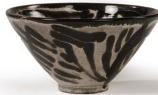
113 Bis COUPE EN FAÏENCE à décor émaillé noir sur fond crème marqué Saint Leu sous la base France, années 1960 H. 10 cm, Diam. 18,5 cm € 50 – 80