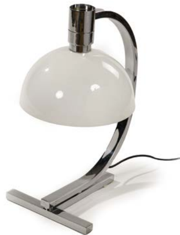
29 LAMPE DE TABLE en métal chromé et abat-jour en perspex Modèle conçu par Franco ALBINI (1905-1977) Première édition Italie 55 x 45 x 30 cm € 600 – 800