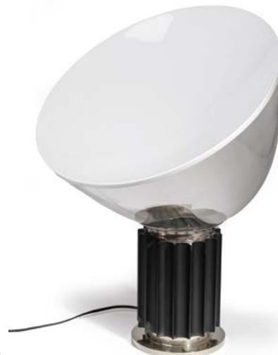
142 LAMPE À POSER AU SOL OU DE TABLE en métal et verre soufflé Modèle «TACCIA» conçu par Achille et Pier Giacomo CASTIGLIONI (1918-2002 & 1913-1968) vers 1962 Italie H. 48 cm, Diam. 50 cm € 900 - 1 200