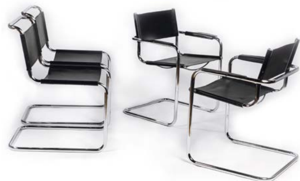
151 PAIRE DE FAUTEUILS ET PAIRE DE CHAISES style B34 piètement en métal chromé assise en cuir tendu Modèle dans le goût de Marcel BREUER (1902-1981) France, années 1980 Fauteuil 80 x 55 x 55 cm Chaise 82 x 49 x 60 cm € 300 – 500