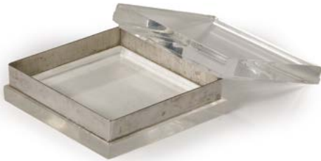
113 BOÎTE EN PLEXIGLAS de forme losange en plexiglas et monture Inox France, années 1970 7 x 23 x 14,5 cm € 80 – 100