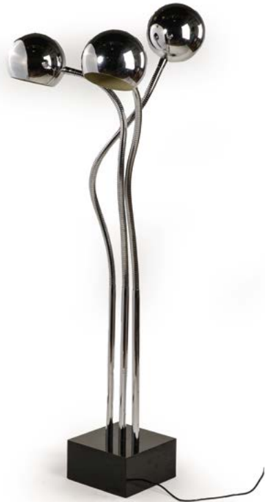
133 LAMPADAIRE À TROIS FEUX sur flexibles en métal chromé et base stratifié noir Modèle conçu par Goffredo REGGIANI (XX e siècle) Italie, vers 1970 H. 160 cm € 400 – 800