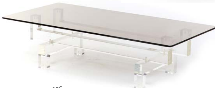
156 RARE TABLE BASSE MODULABLE en plexiglas et plateau de verre fumé Modèle conçu par Michel DUMAS (XX) France, années 1970 31 x 120 x 60 cm € 700 – 1 400