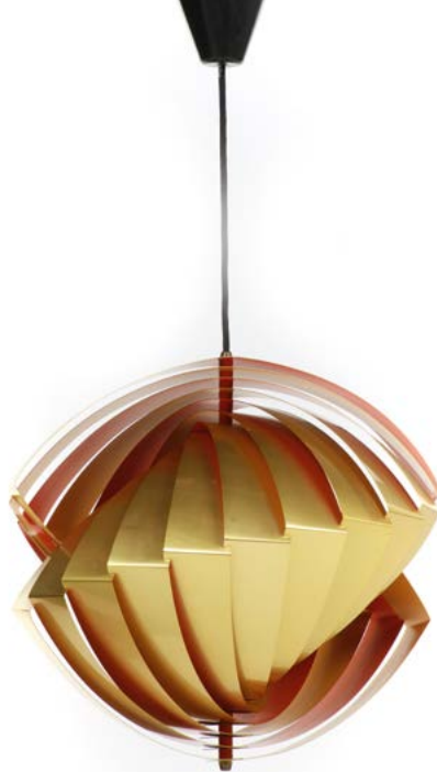
165 SUSPENSION HELICOÏDALE à lamelles de laiton doré et intérieur laqué jaune et orange Modèle «Konkylie» conçu par Louis WEISDORF (né en 1932) Édité par Lyfa Danemark, années 1960 40 x 40 x 40 cm € 1 100 – 1 500