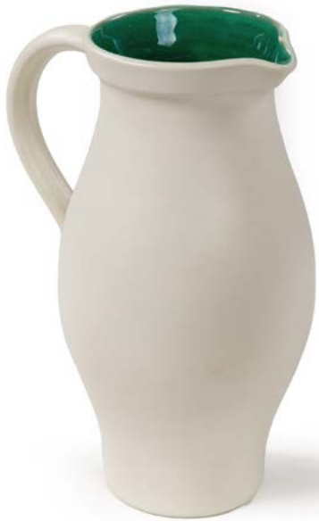
145 PICHET EN CÉRAMIQUE émaillée blanc satiné et vert à l'intérieur, signé Modèle conçu par Elchinger H. 24 cm € 50 – 80