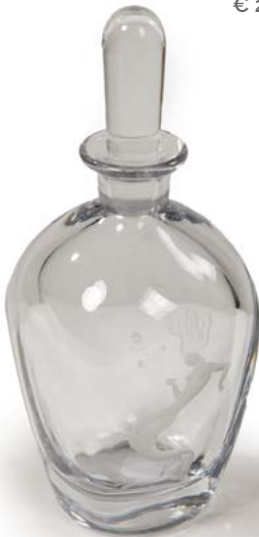
61 ORREFORS Carafe en cristal gravée d'une sirène H. 22 cm € 80 – 100