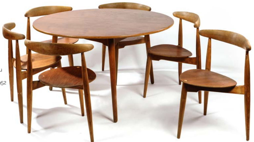
19 ENSEMBLE DE SALLE À MANGER COMPRENANT UNE TABLE ET SIX CHAISES en teck et bouleau Modèle «HEART» conçu par Hans J. WEGNER (1914-2007) en 1952 Édité par Fritz Hansen Danemark Table H. 72 cm, Diam. 120 cm Chaise 73 x 45 x 50 cm € 3 000 - 4 500