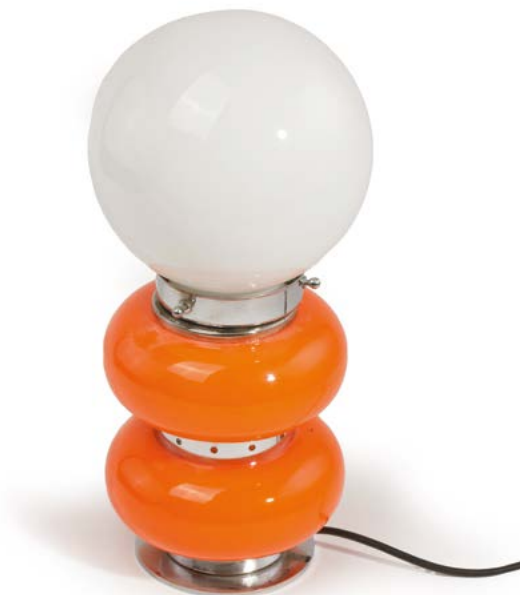
120 LAMPE DE SALON en verre soufflé orange, métal chromé, le globe en verre opalin Modèle dans le goût de Carlo NASON (né en 1935) Édité par Mazzega Italie, années 1960 H. 34 cm, Diam. 17 cm € 200 – 400