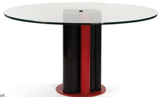
106 IMPORTANTE TABLE MEMPHIS en acier laqué et plateau de verre Distribué par Roche Bobois France Italie, années 1980 H. 70 cm, Diam. 130 cm € 1 500 – 3 000