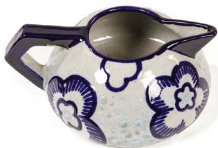
21 PICHET EN GRÈS à décor floral bleu Modèle conçu par Roger FRANÇOIS Atelier MALICORNE 10 x 23 x 17 cm € 50 – 80