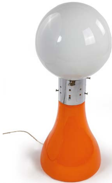
40 LAMPE À POSER AU SOL en verre de Murano à trois niveaux d'éclairage Modèle conçu par Carlo NASON (né en 1936) Italie, années 1970 H. 100 cm, Diam. 40 cm € 500 – 1 000