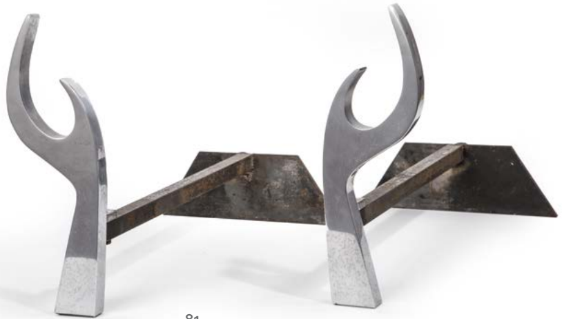
81 PAIRE DE CHENETS en métal chromé figurant des mains Modèle conçu par Jean Paul Création Années 1970 H. 29 cm, L. 41 cm € 600 – 800