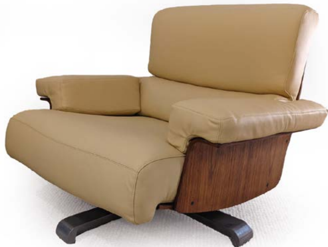
155 FAUTEUIL la structure en palissandre et les coussins garnis de cuir gold Modèle «CORDOUE» conçu par Tito AGNOLI (né en 1931) Edité par Steiner Années 1960 100 x 95 x 76 cm € 2 500 – 3 000