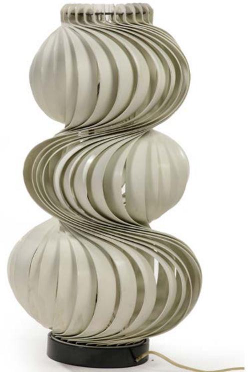
33 ICONIQUE LAMPE À POSER AU SOL lamelles en aluminium laqué blanc Modèle «MEDUSA» conçu par Olaf VON BOHR (né en 1927) en 1968 Édité par Ecolight pour Valenti Italie H. 70 cm, Diam. base 35 cm € 1 500 – 2 500