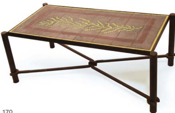
170 TABLE BASSE en métal martelé et plateau de céramique émaillée à motif de feuille Modèle dans le goût de Jacques DOUCET France 42 x 109 x 58 cm € 400 – 600

Bibliographie : Modèle similaire reproduit dans: - Catalogue de l'exposition, Verner Panton The collected works, Edition Vitra Design Museum, 2000, p.275. - Jeryll Habegger & Joseph H.Osman. Sourcebook of modern furniture, Edition Norton & Company, 2005, p.239.