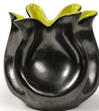
137 VASE MOUCHOIR en céramique émaillée noir et intérieur jaune signé Modèle conçu par Elchinger H. 10 cm € 40 - 60