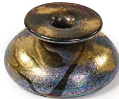
56 ENCRIER EN VERRE irisé rehauts dorés signé et numéroté sous la base Modèle conçu par Michèle LUZORO (né en 1949) H. 7 cm, Diam. 14 cm € 60 – 80