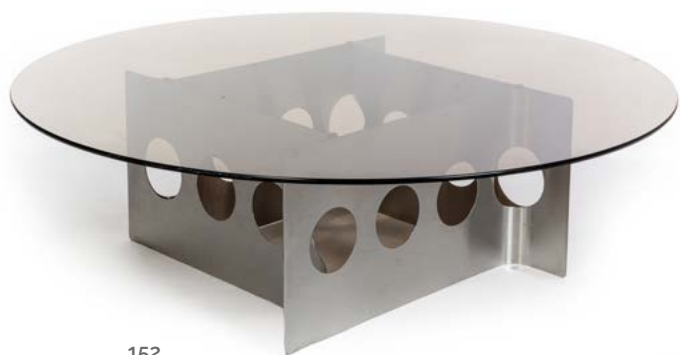
152 TABLE BASSE en inox en plateau rond de verre fumé France, années 1970 Diam. 107 cm € 400 – 800