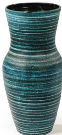
75 VASE EN CERAMIQUE émaillé turquoise bleu marqué sous la base Modèle conçu par l'atelier ACCOLAY H. 43 cm petit éclat € 80 - 120