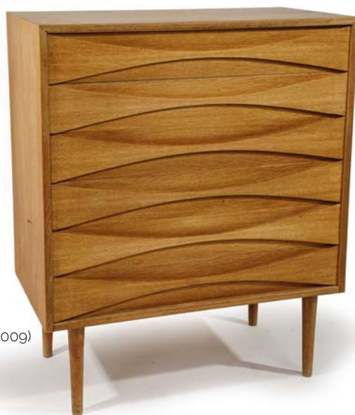
47 COMMODE en chêne ouvrant à six tiroirs Modèle conçu par Arne VODDER (1926-2009) Danemark, années 1960 101 x 84 x 45 cm € 1 500 - 2 500