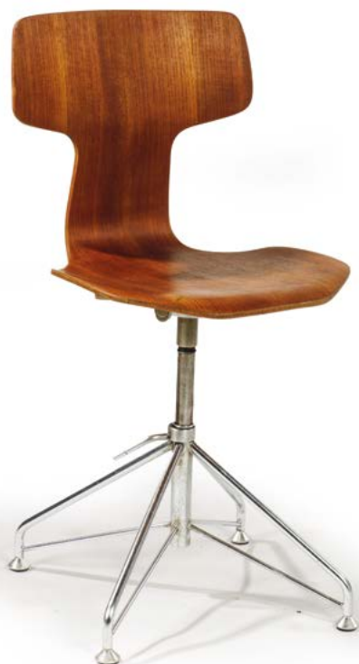
11 CHAISE DE BUREAU PIVOTANTE piètement en métal chromé, assise thermoformée en placage de teck Modèle conçu par Arne JACOBSEN (1902-1971) Édité par Fritz Hansen Danemark, années 1970 € 150 - 300