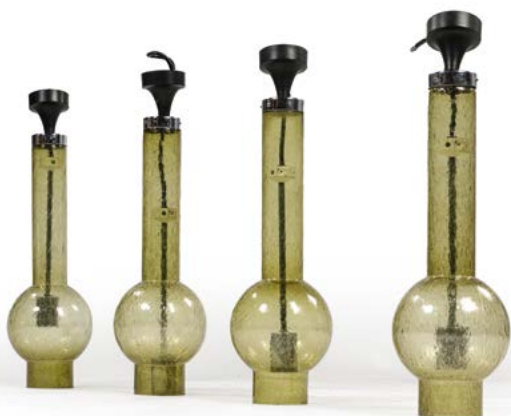
36 ENSEMBLE DE QUATRE SUSPENSIONS en verre bullé Modèle P1115 Édité par Staff Leuchten Allemagne, années 1960 H. 60 cm € 300 – 800