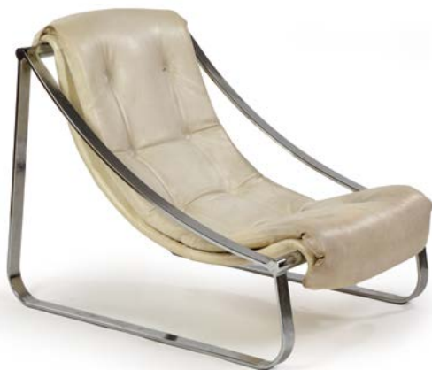
76 DEUX CHAISES LONGUES structures en aluminium chromé et assises en simili cuir blanc et noir France, années 1980 80 x 90 x 64 cm € 300 - 600