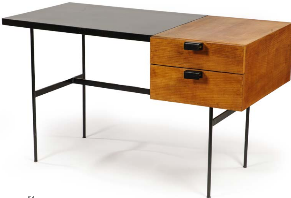
54 ICONIQUE BUREAU CM141 à deux caissons latéraux plaqués, plateau stratifié et piétement métal laqué noir Modèle « CM141 » conçu par Pierre PAULIN (1927-2009) Édité par Thonet France, années 1950 73 x 126 x 62 cm € 2 500-4 000