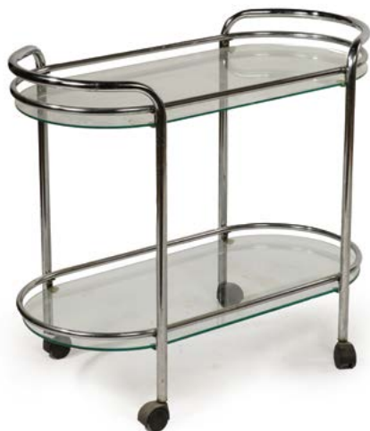
74 TABLE DESSERTER en métal chromé et double plateaux de verre France, années 1970 69 x 81 x 42 cm € 80 - 120