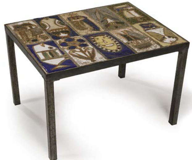
148 TABLE BASSE en céramique émaillée polychrome Modèle conçu par Isabelle FERLAY (né en 1917) Édité pour l'Atelier de Vallauris «Les Argonautes» France, années 1960 32 x 50 x 38 cm € 500 – 600

Bibliographie : - «Modern furniture designs 1950-1980s», K.J. Sembach, édition Schiffer, modèle similaire reproduit sous les n° 401 et 402 page 119. - «S'asseoir», Musée de Grenoble, catalogue de l'exposition, 1974, modèle similaire reproduit page 18. «L'utopie du tout plastique», P. Decelle, D. Hennebert, P. Loze, édition de la fondation pour l'architecture, Bruxelles, modèle similaire reproduit page 52.