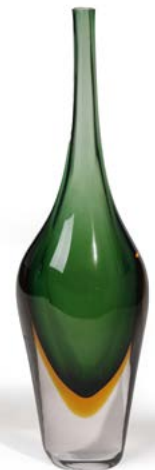
35 VASE SOLIFLORE en verre de Murano à petit col vert et orangé H. 44 cm, Diam. 14 cm € 200 – 300