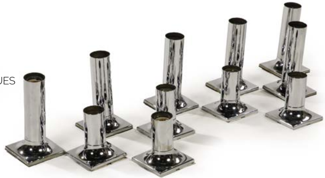
114 ENSEMBLE DE ONZE LAMPES À POSER OU APPLIQUES en métal chromé Modèle conçu par Rolf KRÜGER (XX) Édité par Staff Leuchten Allemagne, années 1970 € 400 – 800