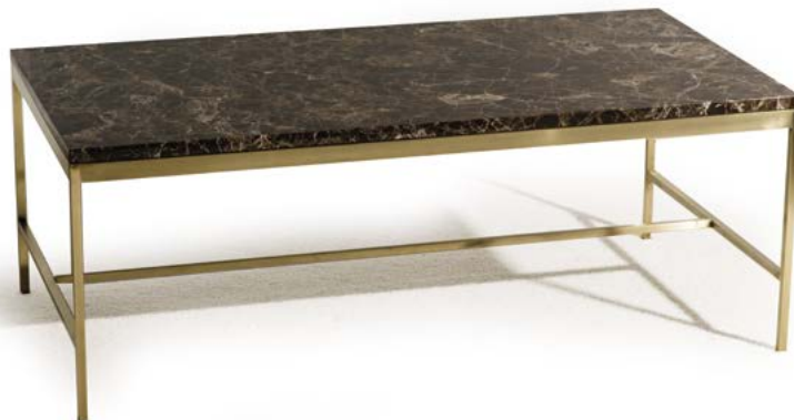
103 TABLE BASSE EN MARBRE et structure en laiton doré Modèle «EMPERADOR DARK» conçu par Paul MACCOBB (1917-1969) États-Unis, années 1960 38 x 100 x 51 cm € 900 – 1 500