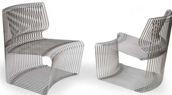
125 PAIRE DE CHAUFFEUSES en tiges d'acier Modèle «PANTONOVA» conçu par Verner PANTON (1928-1998) Édité par Fritz Hansen Années 1970 76 x 56 x 56 cm € 2 800 – 3 600