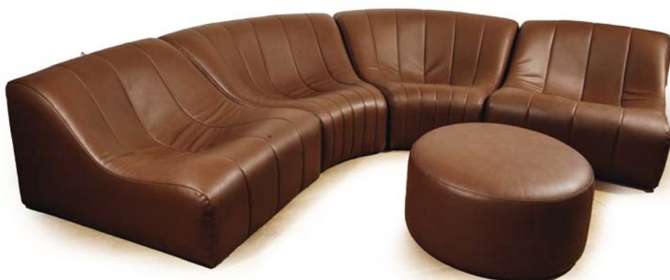
46 CANAPÉ QUATRE PLACES MODULABLE en simili cuir marron d'origine Édité par Steiner Plaque de l'éditeur sur chaque élément € 4 000 - 5 000