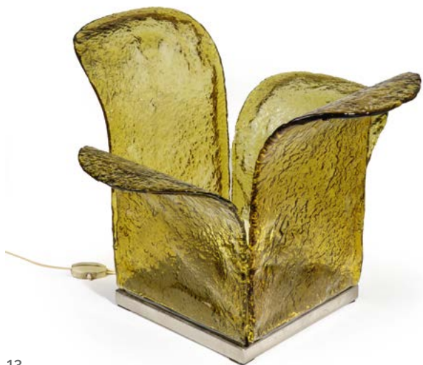
13 LAMPE DE TABLE «CACTUS» en verre de Murano Modèle conçu par Aldo NASON (né en 1920) Italie, années 1970 38 x 52 x 52 cm € 600 – 800