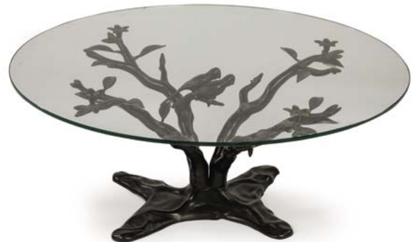
91 TABLE BASSE BONSAÏ structure en laiton émaillé noir, plateau de verre circulaire Années 1970 H. 42 cm, Diam. 100 cm € 300 – 800