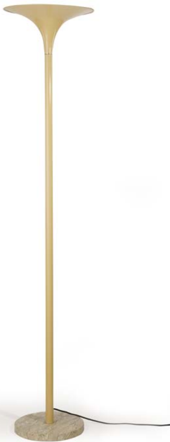
3 LAMPADAIRE en métal laqué crème Édité par Stilnovo Italie, années 1960 H. 180 cm, Diam. Base. 31 cm, Diam. Haut. 38 cm € 600 – 1 000