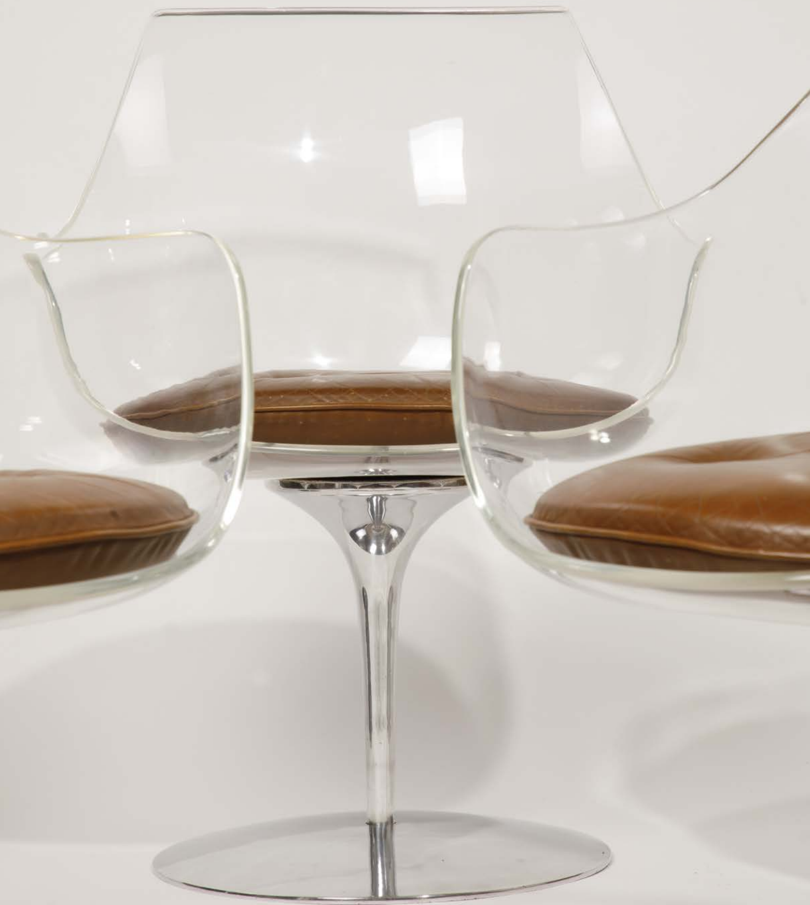
Détail du lot N° 78