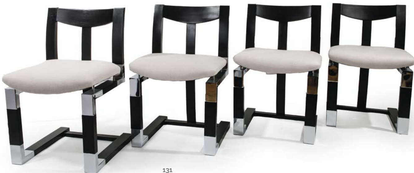
131 ENSEMBLE DE QUATRE CHAISES en bois et métal Italie, années 1970 76 x 47 x 46 cm € 600 – 800