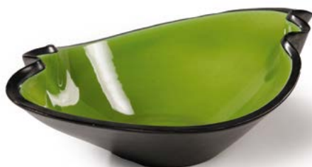
138 COUPE en céramique émaillée noir et vert olive Modèle conçu par Elchinger € 40 - 60