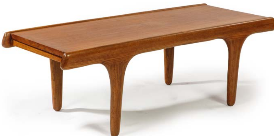
39 TABLE BASSE en teck Travail des années 1960 58 x 120 x 45 cm € 400 – 800