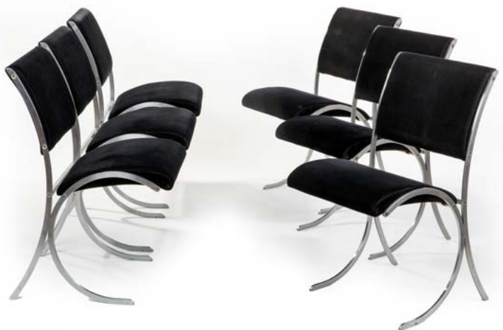
159 SUITE DE SIX CHAISES en métal chromé et velours noir Edité par la Maison Jansen Paris, France, années 1970 82 x 44 x 45 cm € 1 100 – 1 800