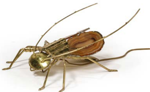
15 APPLIQUE OU LAMPE DE TABLE en laiton doré formant un insecte aux ailes d'agate Modèle attribué à Claude DUVAL BRASSEUR (XX) France, années 1970 35 x 12 x 22 cm € 600 – 1 000