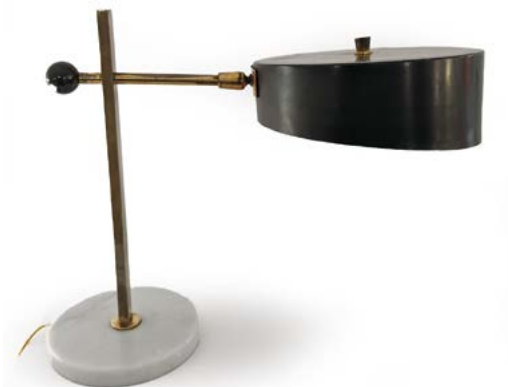
149 LAMPE DE TABLE en métal laqué noir, laiton et marbre noir Italie, années 1950 37 x 33 x 20 cm € 300 – 400