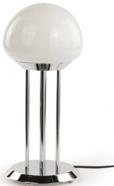
96 LAMPE À POSER en métal chromé et abat-jour en verre opalin Italie, vers 1980 H. 40 cm, Diam. 20 cm € 250 – 500