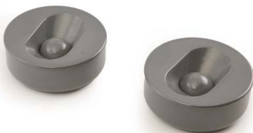
129 PAIRE DE CENDRIERS en plastique gris Modèle «COROLLE» conçu par Jean-René TALOPP (né en 1950) en 1982 Édité par Samp Design- Manade France H. 5,5 cm, Diam. 13,5 cm € 35 – 50