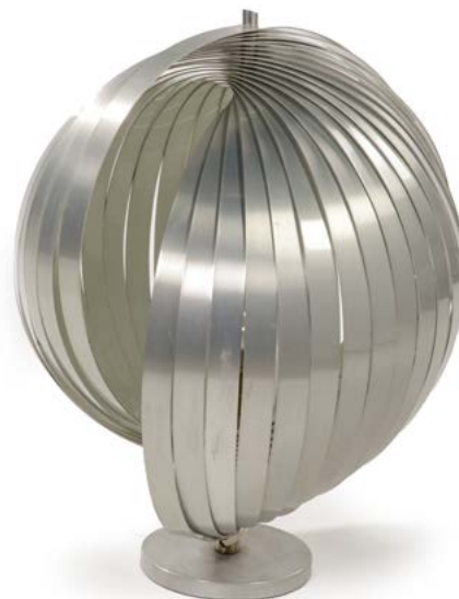
158 LAMPE À POSER en lamelles d'aluminium Modèle «MOON» conçu par Henri MATHIEU (XX) France, années 1970 H. 50cm, Diam. 40 cm € 1 000 – 1 500