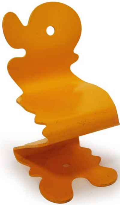
168 CHAISE à assise et dossier monobloc en bois thermoformé et cintré à découpe géométrique laqué jaune Modèle Pantonic 5010 conçu par Verner PANTON (1926-1998) en 1992 Édité par Studio Hag 91 x 46 x 53 cm € 600 – 800