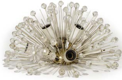
59 APPLIQUE MURALE en laiton et verre Modèle conçu par Emil STEJNAR (né en 1939) Édité pour Rupert Nikoll H. 20 cm, Diam. 36 cm € 300 – 500