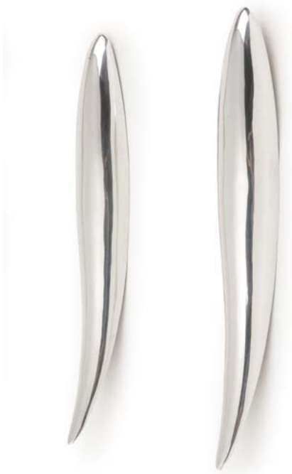
141 PAIRE D'APPLIQUES «FLAMBEAU» en fonte d'aluminium Travail des années 1960-1970 L. 36 cm € 250 - 500