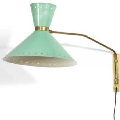
48 APPLIQUE MURALE bras en laiton et abat-jour en métal laqué vert Modèle «COCOTTE» France, années 1950 42 x 35 x 71 cm € 300 – 400