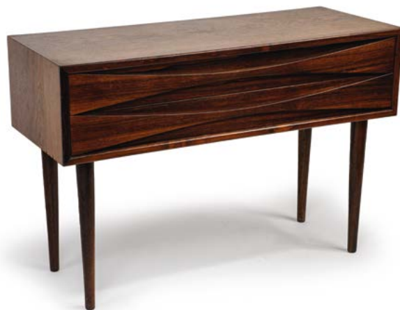
51 PETIT MEUBLE DE RANGEMENT ouvrant à deux tiroirs en palissandre Modèle conçu par Arne VODDER (1926-2009) Danemark, années 1960 80 x 54 x 32 cm € 1 200 – 2 000