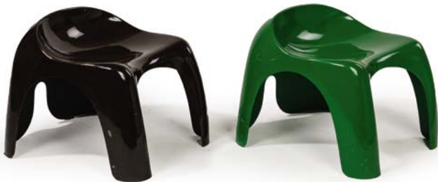
147 PAIRE DE TABOURETS en A.B.S. vert et noir, marque sur le revers dans la masse Modèle «EFEBO» conçu par Stacy DUKES en 1970 Édité par Artemide, 40 x 42 x 48 cm € 300 – 500