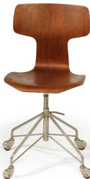
37 CHAISE DE BUREAU À ROULETTES PIVOTANTE piètement en métal chromé, assise en teck thermoformé Modèle «MARTEAU N°3103» conçu par Arne JACOBSEN (1902-1971) Édité par Fritz Hansen Danemark, années 1960 80 x 43 x 44 cm € 250 – 500