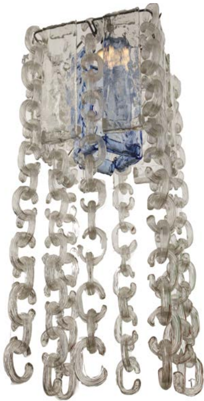
84 SUSPENSION EN VERRE de Murano Modèle conçu par Fratelli TOSO Italie, années 1970 115 x 50 x 50 cm € 1 200 - 2 000