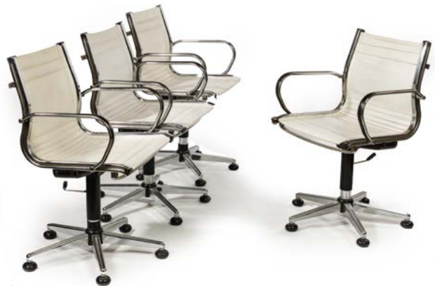
164 SUITE DE QUATRE FAUTEUILS de visiteurs à piétement en métal chromé à hauteur réglable assise en simili cuir blanc France, années 1980 90 x 57 x 60 cm € 200 – 400

Bibliographie : - Elisabeth Vedrenne : « Pierre Paulin », éditions Assouline, 2004, modèle reproduit page 52 et double page 54-55.