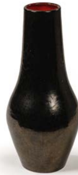
105 VASE BALUSTRE en céramique émaillée noir et rouge Modèle dans le goût de Elchinger France, années 1970 H. 29 cm € 50 – 80