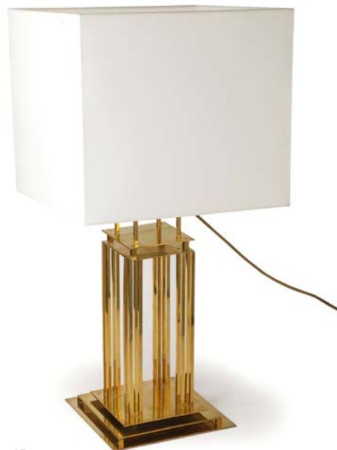
45 TRÈS GRANDE LAMPE SKYCRAPPERS en laiton doré Pièce unique «EMPIRE STATE BUILDING» réalisée sur commande spéciale Années 1950 81 x 40 x 40 cm € 1 100 - 1 500