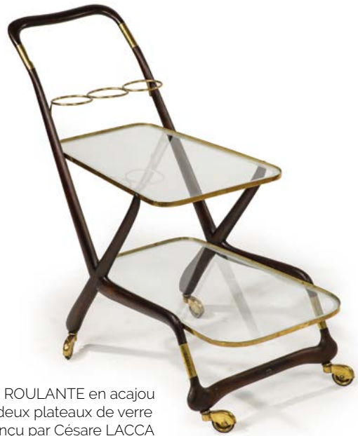
2 DESSERTES ROULANTE en acajou et laiton à deux plateaux de verre Modèle conçu par Césaire LACCA (né en 1929) Italie, années 1950 78 x 90 x 40 cm € 200 – 600