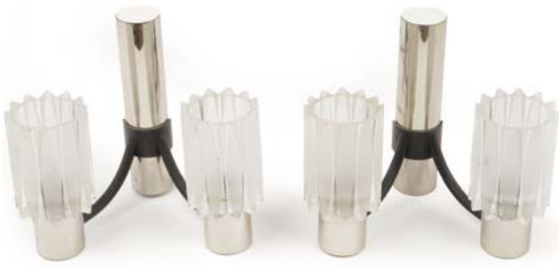
1 PAIRE D'APPLIQUES à deux branches en métal laqué noir, métal chromé et verre Travail des années 1950 18 x 22 x 13 cm € 250 – 500