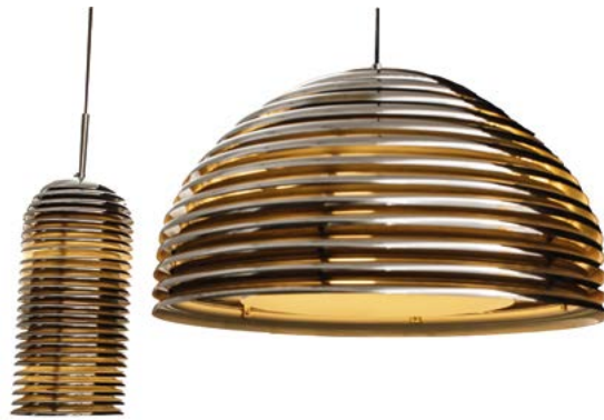
100 ENSEMBLE DE DEUX SUSPENSIONS en métal chromé et cuivré Modèle «SATURNO» conçu par Kazuo MOTOZAWA en 1972 Édité par STAFF LEUCHTEN Japon, années 1970 H. 50 cm, Diam. 18 cm H. 40 cm, Diam. 50cm € 1 000 – 1 500