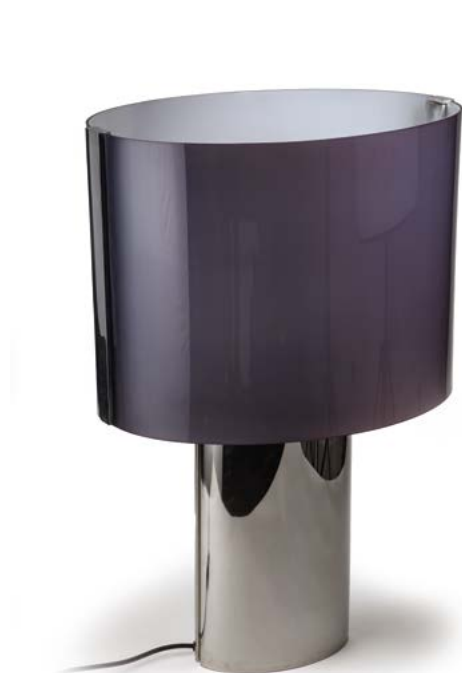
93 LAMPE DE TABLE en tôle chromé et plexiglas blanc et bleu Modèle «Dada de Negri» Édité par Knoll International New-York, Années 1970 68 x 46 x 36 cm € 1 000 – 1 500