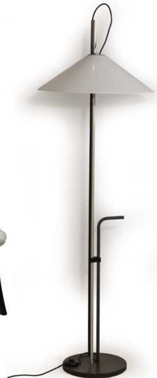
119 LAMPADAIRE piétement en aluminium laqué noir et abat-jour en plexiglas Modèle «AGGREGATO» conçu par Enzo MARI & Giancarlo FASSINA (XX) Édité par Artemide Italie, années 1970 H. 165 cm, Diam. 53 cm € 700 – 900