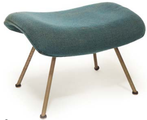
169 OTTOMAN assise coque recouverte d'un tweed bleu clair et piétement métal tubulaire laqué gris Modèle «OYSTER» conçu par Pierre PAULIN (1927-2009) Édité à partir de 1959 par Artifort France, années 1970 40 x 56 x 39 cm € 300 – 600