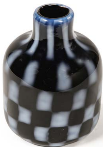
9 PETIT VASE À COL RESSERRÉ en verre à décor de damier noir et blanc Modèle dans le goût de Murano H. 13 cm € 80 - 100