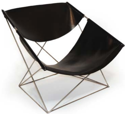
163 FAUTEUIL à structure en acier chromé, assise et dossier tendus de cuir noir Modèle «F675 Butterfly» conçu par Pierre PAULIN (1927 - 2009) Édité par Artifort 62 x 82 x 68 cm € 600 – 1 000