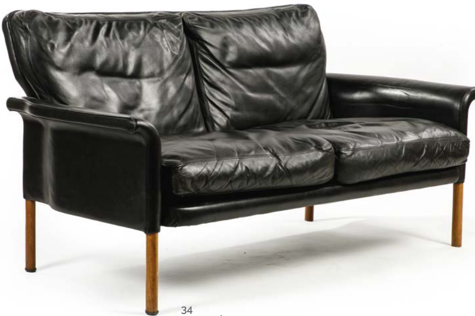
34 CANAPÉ en cuir noir et piétement en bois naturel Travail scandinave, années 1960 120 x 74 x 63 cm € 700 – 1 000