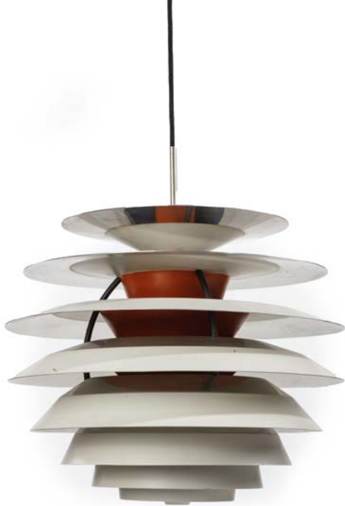
28 SUSPENSION en métal laqué et chromé Modèle «KONTRAST» conçu par Poul HENNINGSEN (1894-1967) Édité par Louis Poulsen Danemark, années 1960 H. 40 cm, Diam. 45 cm € 1 200 – 2 000