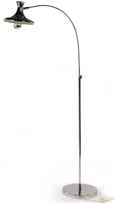
89 LAMPADAIRE ARC en métal chromé réglable en hauteur, l'abat-jour en forme de diabolo Années 1970 70 x 70 x 30 cm € 150 – 300