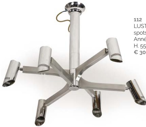
112 LUSTRE À SIX FEUX en aluminium chromé, spots orientables Années 1970 H. 55 cm, Diam. 80 cm € 300 – 800