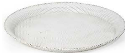
66 PLATEAU EN MÉTAL perforé blanc Modèle conçu par Mathieu MATEGOT (1910-2001) France, années 1950 Diam. 33 cm € 150 – 200