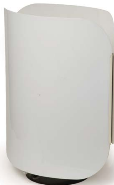
130 RARE LAMPE DE SALON en métal laqué, opaline et perspex Édité par Europhane France, années 1960-1970 52 x 44 x 24 cm € 500 – 1 000