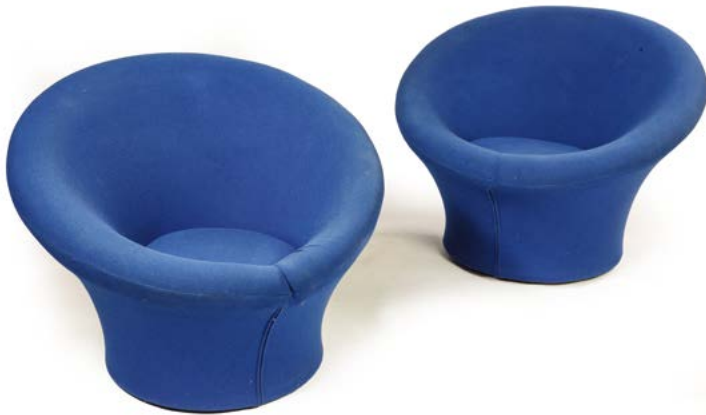
90 PAIRE DE FAUTEUILS à structure en métal garni de mousse et recouverts de tissu bleu Modèle «F560» dit «MUSHROOM» conçu par Pierre PAULIN (1927-2009) France, années 1970 70 x 88 x 90 cm € 1 000 – 1 500