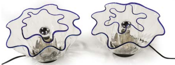
157 PAIRE DE LAMPES pouvant former appliques en verre transparent et bleu Modèle «GALEA» conçu par Adalberto DAL LAGO (né en 1937) vers 1968 Édité par Vistosi Italie H. 15 cm, Diam. 22 cm € 1 800 – 2 000