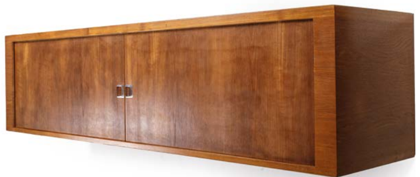
43 GRAND ENFILADE SUSPENDUE en teck Modèle «RY 26» conçu par Hans J. WEGNER (1914-2007) Édité par Ry Danemark, années 1960 200 x 50 x 51 cm € 3 200 – 4 000