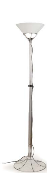
129 Bis RARE LAMPADAIRE en fil d'acier et diffuseur en verre opalin Italie, années 1980 H. 175 cm, Diam. Base : 42 cm, Diam. Haut : 35 cm € 800 – 1 500