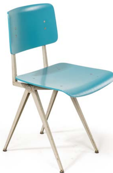
97 CHAISE DE BUREAU le piétement en métal style compas et assise en bois bleu Modèle dans le goût de Paghholz GALVANITAS (XX) 81 x 44,5 x 49 cm € 100 – 150