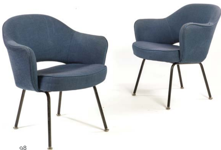
98 PAIRE DE FAUTEUILS à dossier dans le prolongement des accotoirs et assises garnis de mousse et recouverts de tissu bleu, le piétement en acier tubulaire laqué noir garnis de patins orientables Modèle «CONFÉRENCE» conçu par Eero SAARINEN (1910-1961) en 1959 Édité par KNOLL INTERNATIONAL Réédition 75 x 60 x 49 cm € 250 – 450