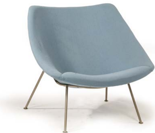
94 FAUTEUIL OU CHAUFFEUSE assise coque recouverte d'un tweed bleu clair et piètement métal tubulaire laqué gris Modèle «OYSTER» conçu par Pierre PAULIN (1927-2009) Édité à partir de 1959 par Artifort France, années 1970 75 x 82 x 64 cm € 1 500 – 2 000