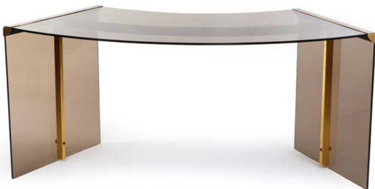
58 BUREAU BOOMRANG «PRÉSIDENT» en laiton et inox doré accompagné d'un caisson de verre fumé Modèle conçu par Pierangelo GALLOTTI & Luigi RADICE Italie, années 1980 74 x 167 x 66 cm € 1 000 – 2 000