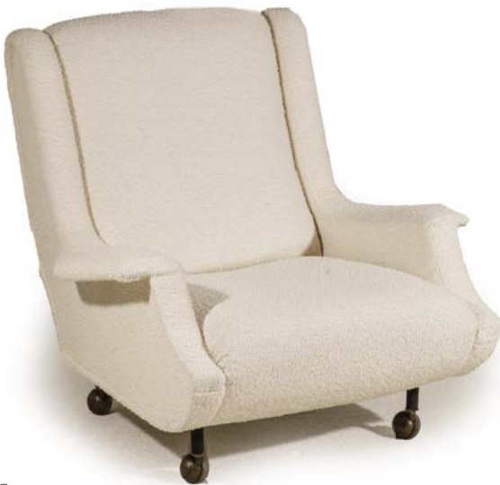
65 FAUTEUIL recouvert de tissu Bisson Bruneel reposant sur un piètement cylindrique en métal laqué noir monté sur des roulettes Modèle «REGENT» conçu par Marco ZANUSO (né en 1954) 86 x 84 x 80 cm € 1 800 – 2 500