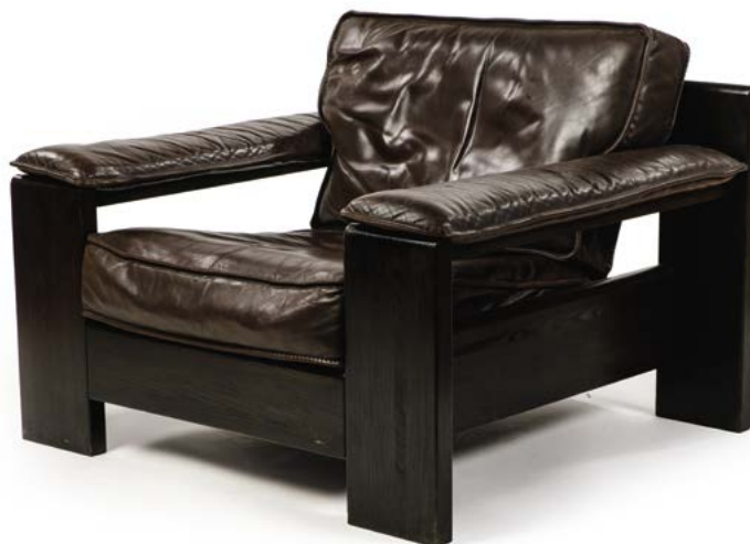
123 PAIRE DE FAUTEUILS BRUTALISTES en bois noir patiné assise en cuir Belgique, années 1970 69 x 94 x 84 cm € 800 – 1 000