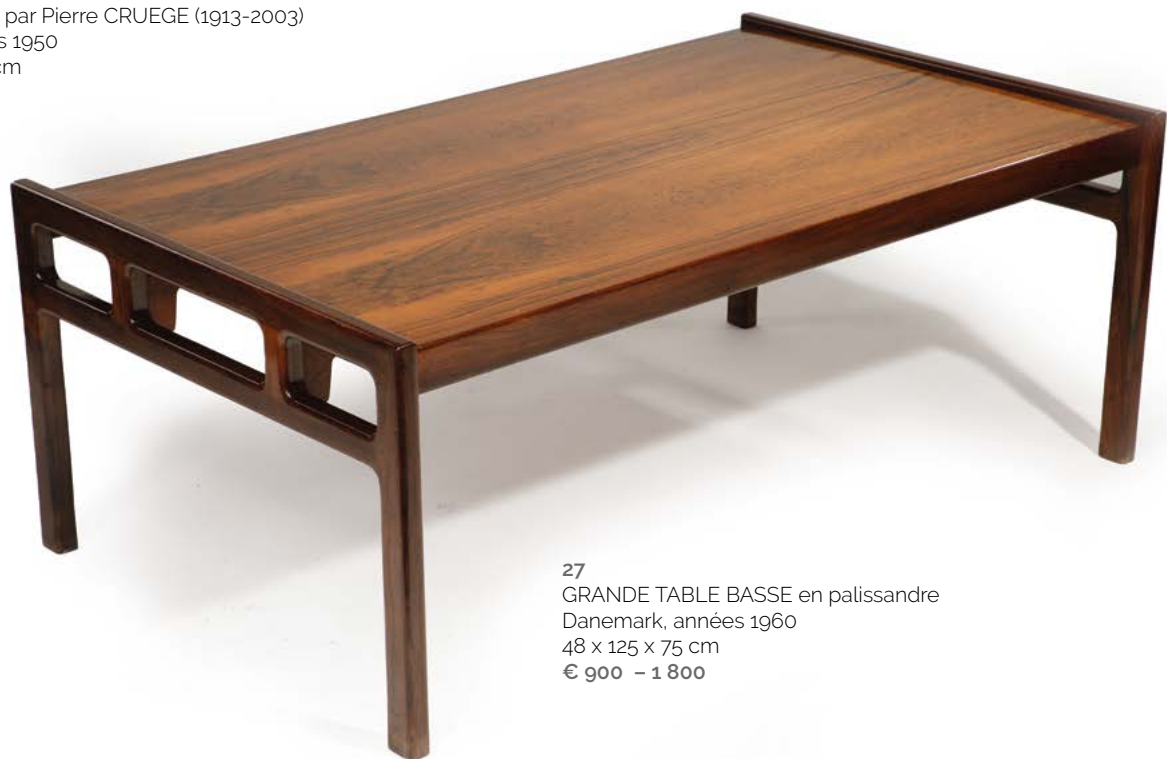
27 GRANDE TABLE BASSE en palissandre Danemark, années 1960 48 x 125 x 75 cm € 900 - 1 800