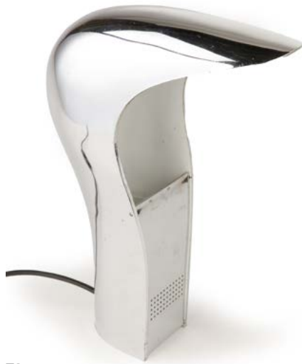
72 LAMPE À POSER en métal chromé Modèle «PELOTA» conçu par Cesare CASATI (1936-2015) et Emanuele PONZIO (1923-2015) Édité par Lamperti Italie, années 1970 33 x 25 x 11 cm € 400 - 600