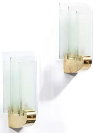
153 PAIRE D'APPLIQUES Modèle attribué à PERZEL en bronze et verre rectangulaire sablé France, vers 1960 37,6 x 18 x 14 cm € 300 – 500