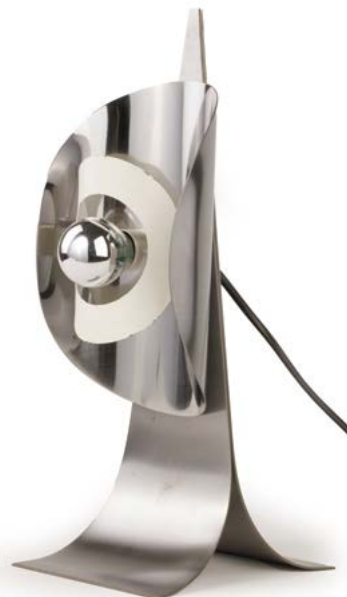
121 LAMPE À POSER Futuriste Space Age en inox brossé et métal laqué France, années 1970 38 x 12,5 x 17,5 cm € 250 – 400