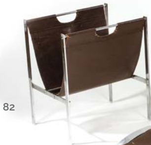
82 PORTE-REVUE en métal chromé et cuir noir Modèle dans le goût de Ludwig MIES VAN DER ROHE (1886-1969) 47 x 41 x 32 cm € 80 – 100