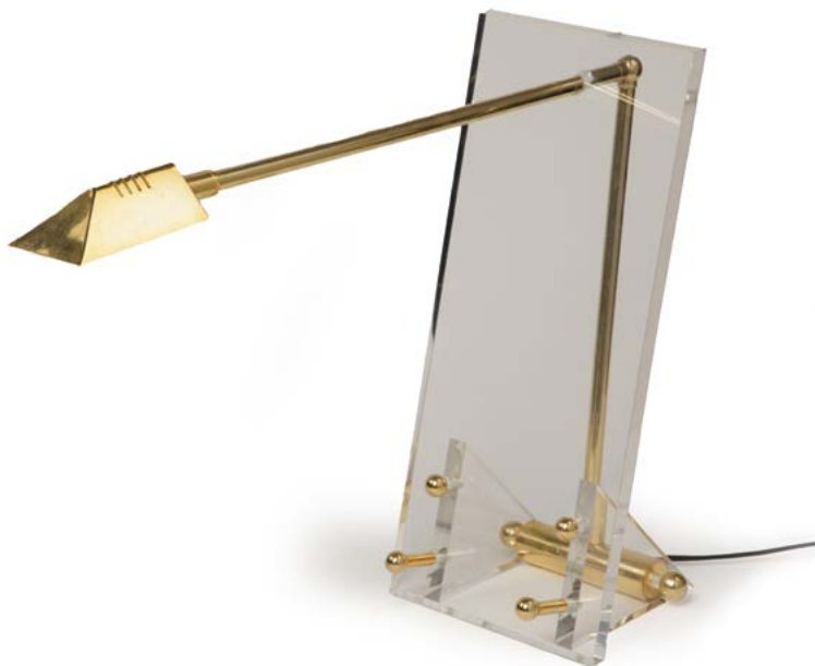
55 RARE LAMPE DE BUREAU en Plexiglas et laiton Italie, années 1960 42 x 57 x 18 cm € 400 – 700