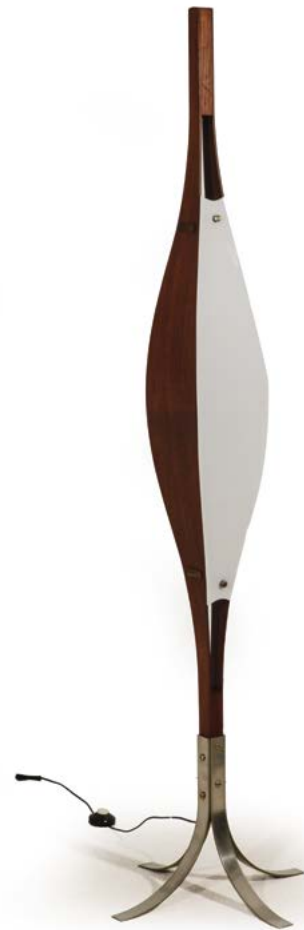
41 LAMPADAIRE «REGGIANI» en bois, métal et plexiglas Italie, années 1960 176 x 49 x 49 cm € 1 400 – 2 000