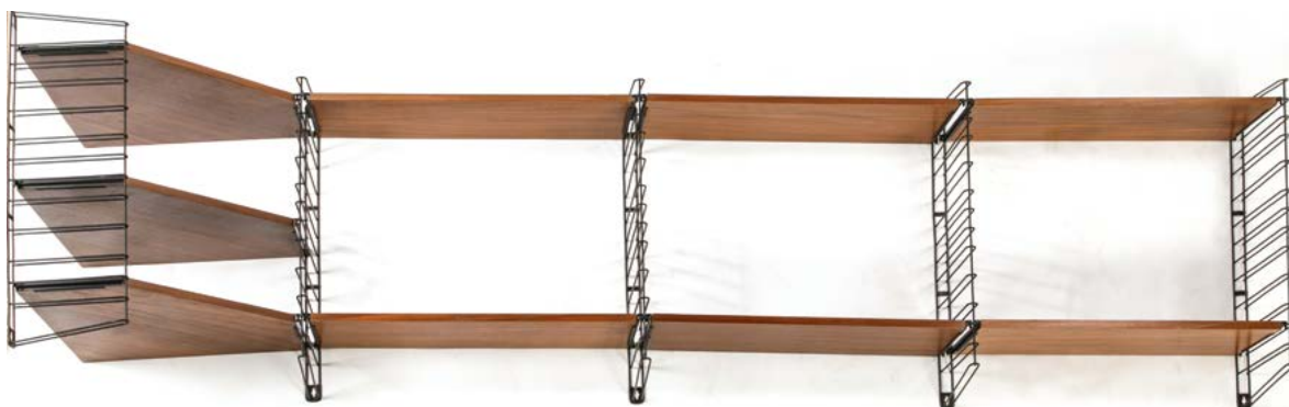
20 ENSEMBLE D'ÉTAGÈRES MURALES MODULABLES Modèle «TOMADO» conçu par Adriaan DEKKER Hollande, années 1960 € 300 – 600