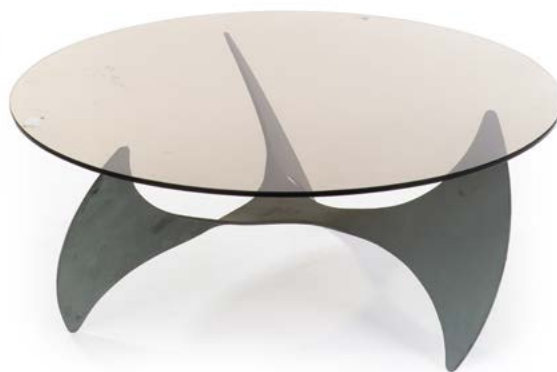
99 TABLE BASSE en acier brossé et plateau de verre fumé Modèle «PROPELLER» conçu par Knut HESTERBERG (XX) en 1967 Édité par Ronald Schmitt Allemagne H. 33 cm, Diam. 80 cm € 500 – 1 000

Bibliographie : Charlotte & Pierre Field – 1000 chairs – Éditions Taschen, Köln, 1997. Modèle identique reproduit page 320.