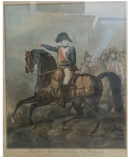
59 - D'après Carl VERNET Napoléon Premier empereur des Français Gravure en couleurs sur papier 85 x 66 cm