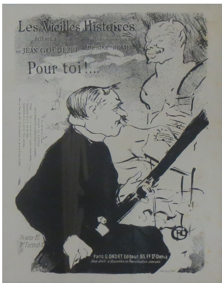
53 - Henri de TOULOUSE-LAUTREC (1864-1901) «Pour toi!...» Lithographie sur papier signé du monogramme de l'artiste dans la planche en bas à droite. 29,5 x 23 cm

CLÔTURE DE LA VENTE: LUNDI 25 MAI 2020 à 14h