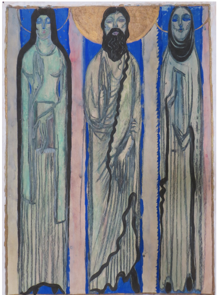
98 - Dans le goût de la Sécession viennoise (1920-1930) Sujets religieux : Ensemble de trois dessins au fusain et à la gouache sur papier - 46 x 33,5 pour 2 - 48 x 33,5 pour 1