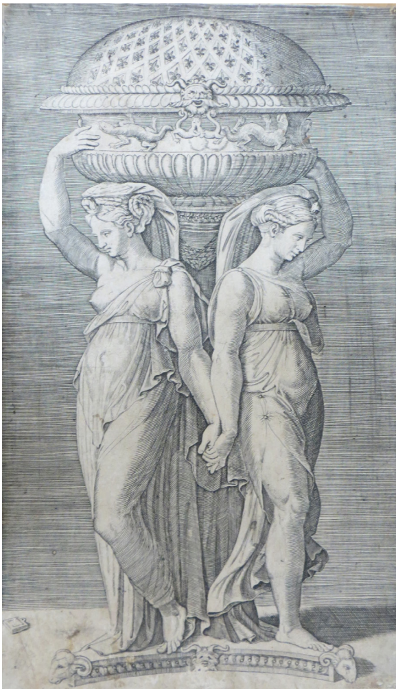
3- Ecole française du XVIIIe siècle Six gravures à la pointe sèche à sujets mythologiques et allégoriques