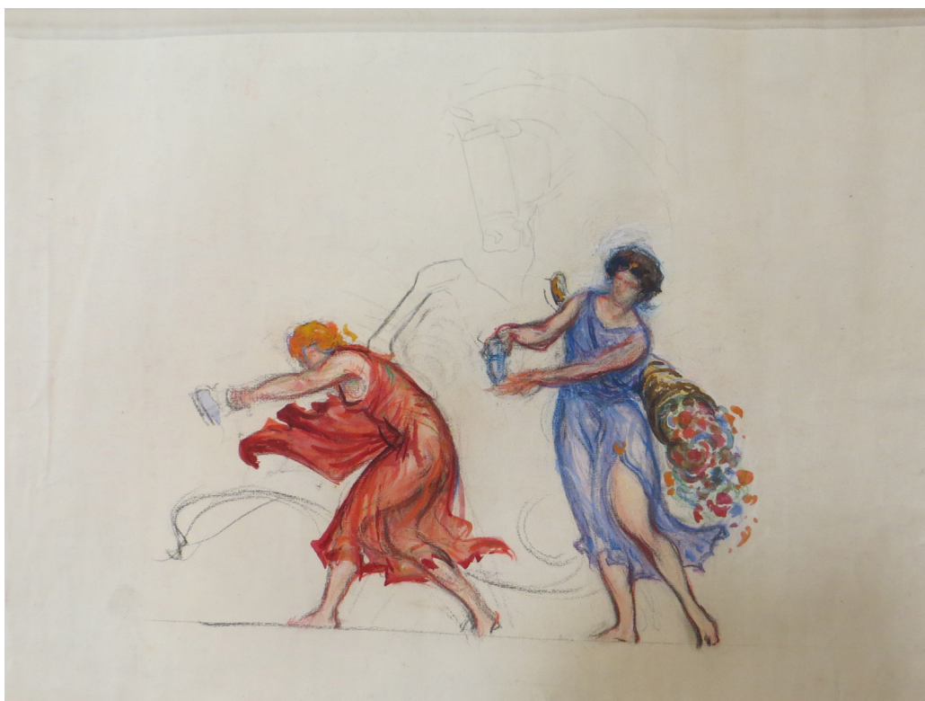
95- École française vers 1900-1930 Danseuses en toge Dessin au mine de plomb, pastel et aquarelle sur papier. 42,5 x 55 cm