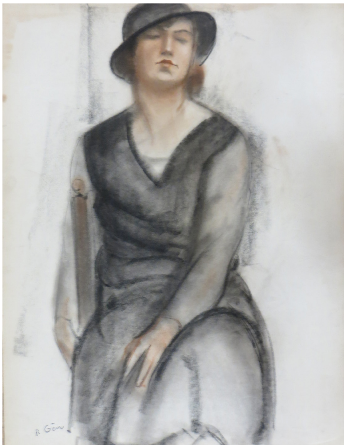
102 - René GEN (XXe siècle) Portraits de Femmes Suite de neuf dessins au fusain et à la sanguine sur papier Signé du cachet de l'artiste Environ chaque : 65 x 50 cm