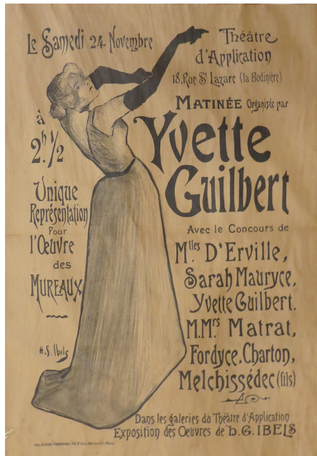
52 - Henri Gabriel IBELS (1867-1936) Affiche Yvette Gilbert sur papier marouffé sur toile signé dans la planche en bas vers la gauche 62 x 46,5 cm