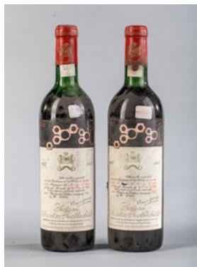
88 Deux bouteilles Château Mouton Rothschild 1 er Gcc Pauillac 1967 € 300 - 400