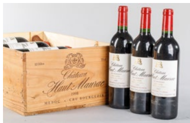
125 Une caisse de douze bouteilles Château Maurac Haut Médoc 1998 € 90 - 120