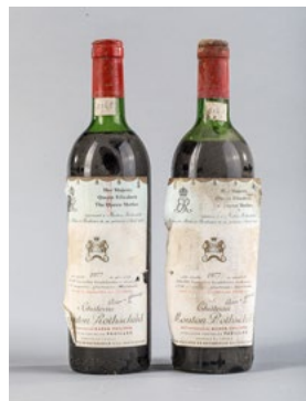
89 Deux bouteilles Château Mouton Rothschild 1 er Gcc Pauillac 1977 Niveaux dans l'épaulement € 350 - 450