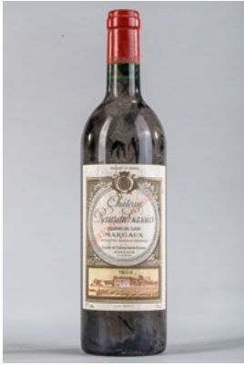
93 Une bouteille Château Rauzan Gassies 2è Gcc Margaux 1984 € 20 - 30