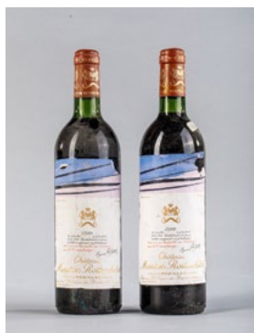
90 Deux bouteilles Château Mouton Rothschild 1 er Gcc Pauillac - 1980 Niveaux légèrement bas € 400 - 500