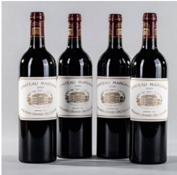
184 Quatre bouteilles Château Margaux 1 er Gcc Margaux 2009 € 1 000 - 1 200