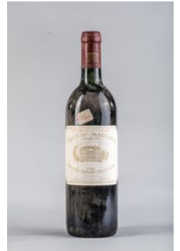
109 Une bouteille Château Margaux 1 er Gcc Margaux 1984 € 150 - 200