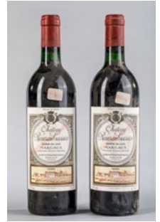
94 Deux bouteilles Château Rauzan Gassies 2è Gcc Margaux 1986 € 40 - 50