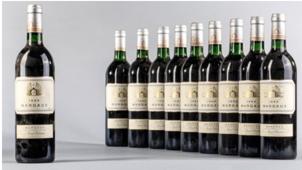
110 Dix bouteilles de Margaux 1989 € 800 - 1 000