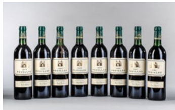
119 Huit bouteilles Pauillac 1989 € 100 - 120