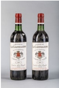
108 Deux bouteilles Château La Gaffelière Saint Emilion Grand Cru 1981 € 30 - 40