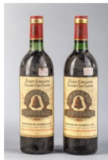
98 Deux bouteilles Château L'Angelus 1 er Gcc Saint Emilion 1979 € 180 - 220