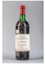
107 Une bouteille Château l'Hermitage Saint Emilion Grand Cru 1986 € 20 - 30