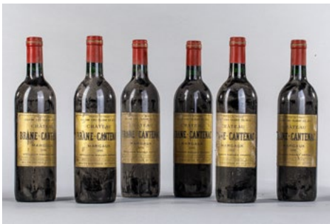
97 Six bouteilles Château Brane Cantenac 2è Gcc Margaux 1986 € 240 - 300