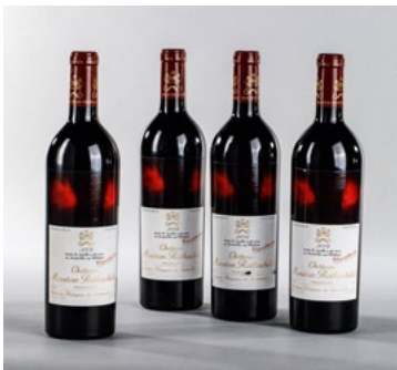
185 Quatre bouteilles Château Mouton-Rothschild 1 er Gcc Pauillac 2009 € 1 200 - 1 500