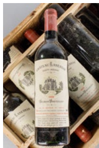
122 Une caisse de douze bouteilles Château Lanessan Haut Médoc 1988 € 120 - 150