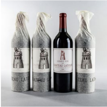
183 Quatre bouteilles Château Latour 1 er Gcc Pauillac 2009 € 1 000 - 1 200