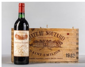
123 Une caisse de douze bouteilles Château Soutard Saint Emilion Grand cru 1982 € 240 - 360