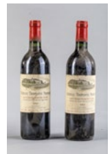
112 Deux bouteilles Troplong Mondot Saint Emilion Grand cru 1983 € 30 - 40