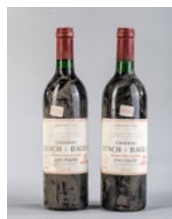
113 Deux bouteilles Château Lynch Bages 5 é Gcc Pauillac 1986 € 180 - 220