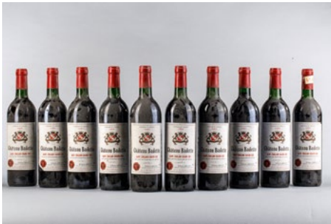
95 Dix bouteilles Château Badette Saint Emilion Grand Cru 1985 € 90 - 120