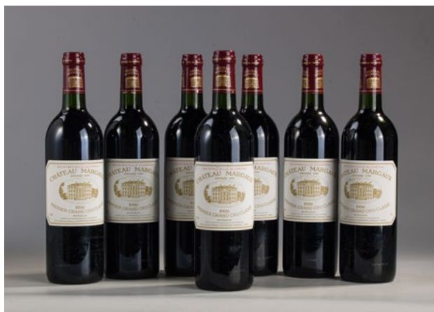
126 Chateau Margaux. Premier grand cru classé 1996 Une caisse de 7 bouteilles. € 2 800 - 3 500