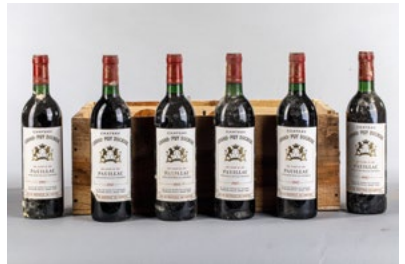
120 Une caisse de douze bouteilles Château Grand Puy Ducasse 5 e Gcc Pauillac 1987 € 240 - 360