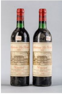
114 Deux bouteilles Château La Pointe Pomerol 1985 € 50 - 60