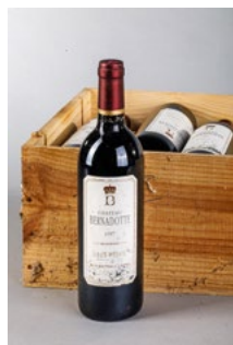
124 Une caisse de douze bouteilles Château Bernardotte Haut Médoc 1997 € 90 - 120