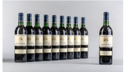
118 Dix bouteilles Saint Estèphe 1990 € 150 - 180