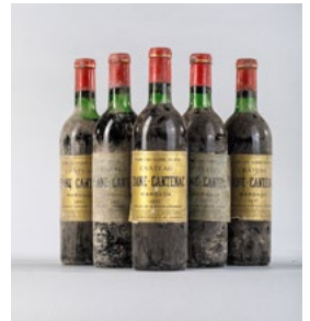
96 Cinq bouteilles Château Brane Cantenac 2è Gcc Margaux 1971 € 120 - 150