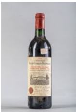
111 Une bouteille Château Grand Corbin Despagne Saint Emilion GC 1985 € 10 - 15