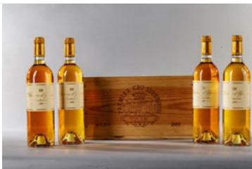
186 Quatre bouteilles Château d'Yquem 1 er Grand cru supérieur, Sauternes 2009 Caisse bois. € 600 - 800