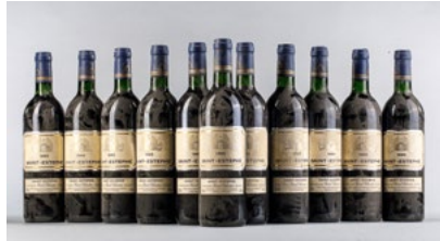
117 Onze bouteilles Saint Estèphe 1985 € 110 - 120