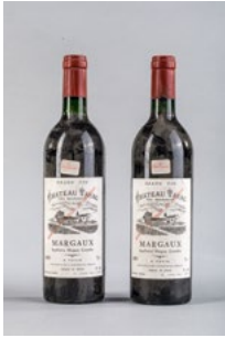
106 Deux bouteilles Château Tayac Margaux 1985 € 10 - 15